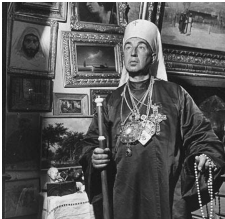
Aleksandr Vvedenskij, l'ultimo leader della "Chiesa vivente"