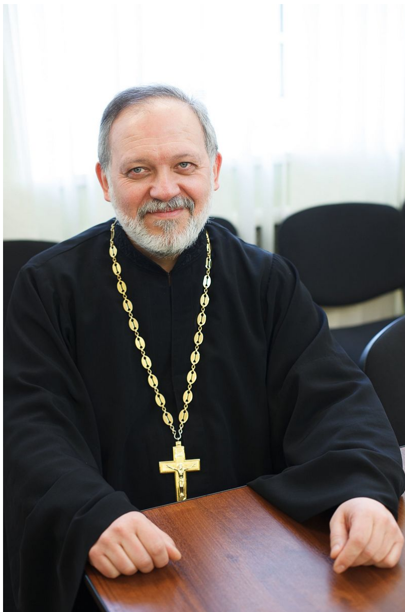
sacerdote Aleksandr Djachenko

Se i credenti lavorano da qualche parte come lavoratori dipendenti, allora dovrebbero prendere parte alle attività sindacali alla pari di tutti gli altri. Non credo che dovremmo opporci al resto dei lavoratori in questo senso. Al contrario, questioni di sicurezza, ottimizzazione della produzione ed equa distribuzione dei compensi del lavoro - tutto ciò dovrebbe rientrare nella sfera degli interessi dei cristiani.