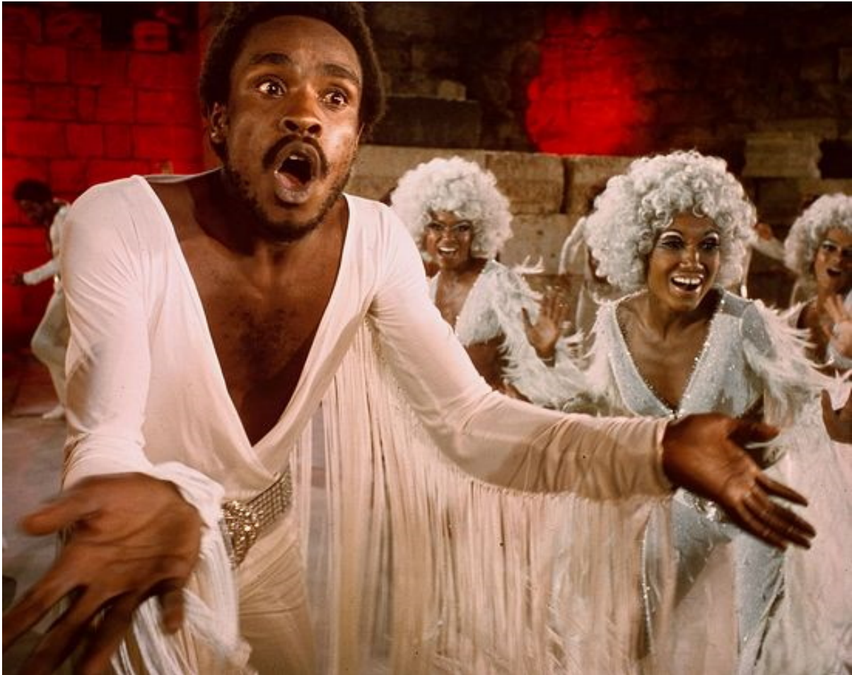
Giuda nel film del 1973 dell'opera rock "Jesus Christ Superstar"

Ora guardiamo solo per un momento ad alcuni dei segni nei nostri tempi che suggeriscono che la seconda venuta di Cristo, preceduta dalla venuta dell'Anticristo, è vicina. Riguardo alle profezie espresse nel capitolo 24 di san Matteo - prima di tutto i falsi cristi che verranno, poi le guerre, le carestie, i terremoti, le persecuzioni - è difficile giudicare, perché tutte queste cose sono accadute ormai da quasi duemila anni. È vero che ora sono su una scala più grande che mai, ma è anche vero che possono essere ancora peggiori. Questi segni sono l'inizio dei segni e non sono ancora così severi da poter dire che siamo proprio negli ultimissimi giorni.