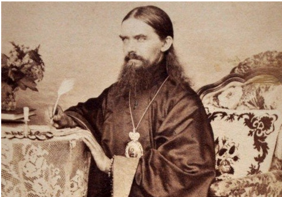
san Teofane il Recluso

Poi ci sono le opere di scrittori più recenti che sono nello stesso spirito patristico dei santi Padri antichi. Gli esempi principali sono i due grandi scrittori della Russia del XIX secolo, san Teofane il Recluso e sant'Ignazio Brjanchaninov, le cui opere stanno uscendo gradualmente in inglese. Ci sono in inglese il libro del vescovo Ignazio L'arena e vari articoli di san Teofane [In seguito di san Teofane sono apparsi in inglese Kindling the Divine Spark, The Path to Salvation, The Spiritual Life e How to Be Attuned To It, ndc ]. Questi due scrittori sono molto importanti perché trasmettono l'insegnamento patristico fino ai nostri giorni. Sono riuscito a spiegare molte domande che sorgono su come comprendere i santi Padri. Per esempio, la rivista The Orthodox Word ha un intero testo del vescovo Ignazio sulle stazioni di pedaggio aeree che l'anima incontra dopo la morte. A volte, leggendo i santi Padri, sorgono domande su tali argomenti e non si sa bene capire cosa dicono i Padri antichi, e questi Padri più recenti spiegano questi testi.