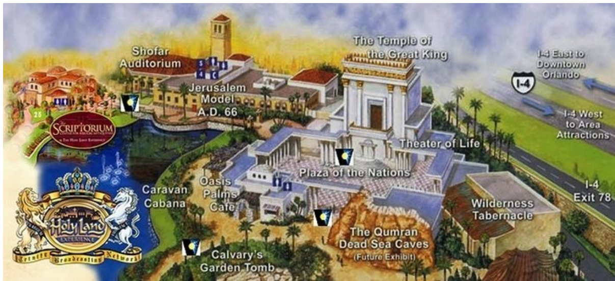
il parco a tema "The Holy Land Experience" a Orlando, in Florida

Ma ora, dal 1967, il sito dove prima si trovava il tempio è ora nelle mani degli ebrei. Pertanto, per la prima volta, diventa del tutto possibile che il tempio possa essere ricostruito. L'unica cosa che interferisce è la grande moschea che i musulmani hanno sul posto. Se viene distrutta, probabilmente ci sarà una guerra.