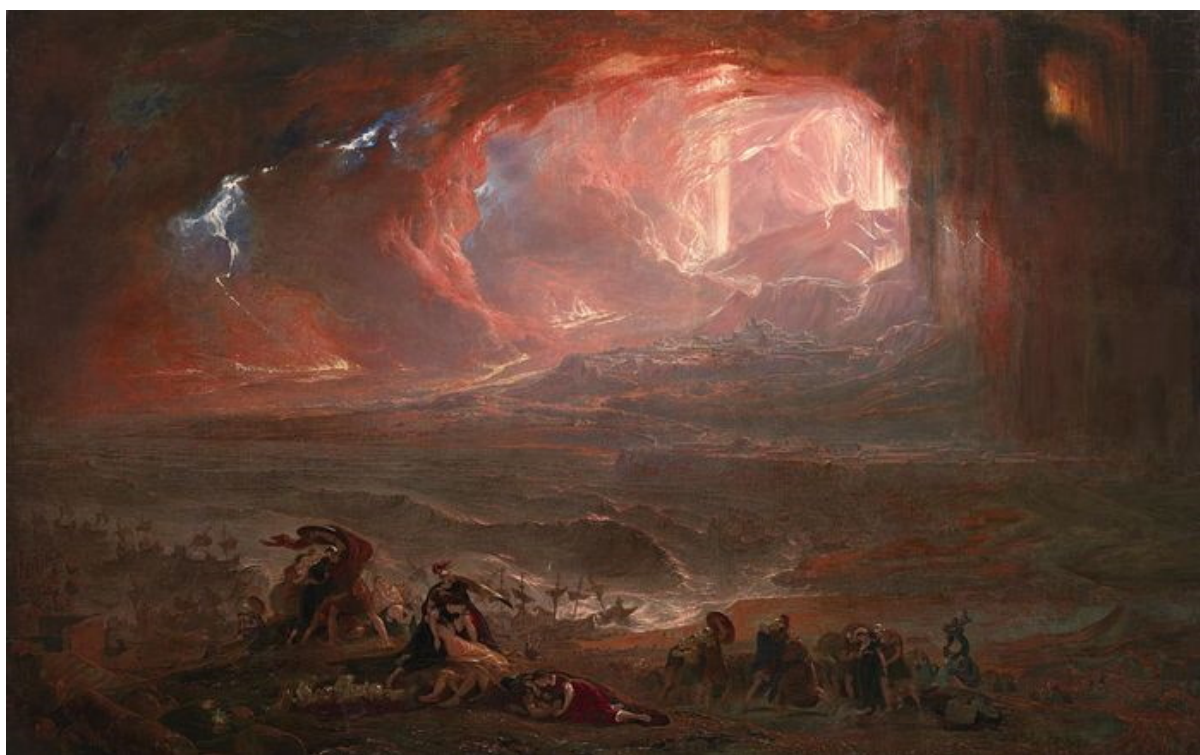
la distruzione di Pompei ed Ercolano, di John Martin

Tutti questi segni dei tempi sono molto negativi. Sono segni che il mondo sta crollando, che la fine del mondo è vicina e che l'Anticristo sta per venire. È molto facile osservare tutti questi segni negativi dei tempi ed entrare in uno stato d'animo tale da cercare solo cose negative. In effetti, si può sviluppare un'intera personalità, una personalità negativa, basata su questo. Ogni volta che arriva una nuova notizia, si dice: "Aha, sì, certo, è così, e andrà sempre peggio". Arriva la notizia successiva e si dice: "Sì, sì, è ovvio che è quello che succederà, e ora sarà anche peggio". Tutto ciò che si guarda è visto semplicemente come un compimento negativo di tempi orribili.