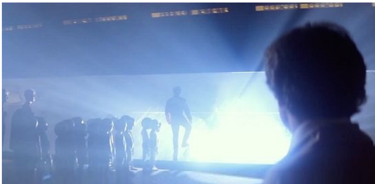
inquadratura dal film del 1977 "Incontri ravvicinati del terzo tipo"

Certo, se leggete sant'Ignazio (Brjanchaninov), saprete di tutti gli inganni che i demoni perpetrano: i demoni "pregano" per te, i demoni fanno miracoli, producono i fenomeni più meravigliosi, portano le persone in chiesa, fanno tutto quello che vuoi, pur di mantenerti in questo inganno. E quando verrà il momento, all'improvviso tireranno fuori i loro trucchi. Quindi queste persone, che sono state convertite a una sorta di cristianesimo da questi cosiddetti esseri dello spazio esterno, stanno aspettando il loro prossimo ritorno; e la prossima volta il loro messaggio potrebbe avere a che fare con Cristo che tornerà presto sulla terra, o qualcosa del genere. È ovvio che tutto questo è opera di demoni. Cioè, le esperienze reali. A volte è solo immaginazione, ma quando è reale questo genere di cose viene ovviamente dai demoni.