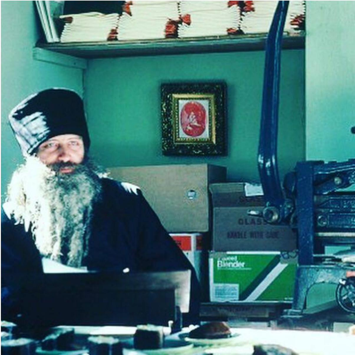
padre Seraphim Rose

L'eredità dello ieromonaco Seraphim (Rose) continua a raccogliere forza come bussola per coloro che cercano la verità nel cristianesimo ortodosso. I suoi libri sono ancora popolari e molti dei suoi discorsi che sono stati registrati sono ora trascritti e disponibili gratuitamente. Uno di questi discorsi si intitola "I segni dei tempi": in esso padre Seraphim offre una panoramica delle tendenze nel mondo moderno della spiritualità, della pseudo-spiritualità e