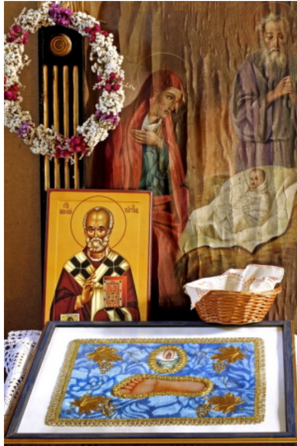
in un monastero ortodosso serbo