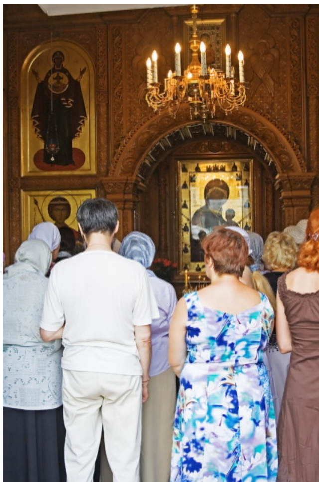
fedeli ortodossi di fronte alle icone dei santi durante una cerimonia

Quanto a ciò che mi ha incuriosito, è proprio il miracolo dell'intercessione dei santi... Un santo la cui intercessione è particolarmente evidente per me è san Mina. È stato nel monastero di San Giovanni Battista a Maldon in Inghilterra che ho sentito parlare di lui. Avevo perso qualcosa ed ero disperato... Un monaco mi ha detto di chiedere l'intercessione di san Mina, e ha aggiunto che fu padre Sofronio che gli aveva insegnato a farlo... Ogni volta che ho chiesto aiuto a questo santo, sono stato esaudito in un modo incredibile (e più volte!) e incomprensibile. Quando lo chiamo, venero la sua icona, gli chiedo di aiutarmi e mi dimentico tutto, decidendo di fare qualcosa d'altro. Poi mi capita di fermarmi improvvisamente, di dirigermi verso un posto e come guidato invisibilmente, trovo quello che cercavo a volte nei posti più inverosimili, o dove avevo cercato più volte con attenzione. La sua presenza è tangibile.