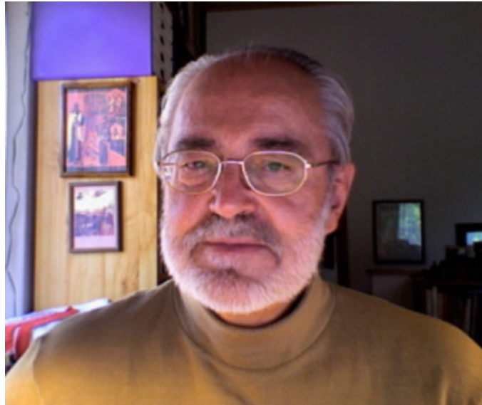
l'autore ortodosso Claude Lopez-Ginisty

Claude Lopez-Ginisty - Nell'Ortodossia, non vi è alcuna canonizzazione come è attualmente si compie in Occidente. Prima viene il culto del popolo di Dio, vale a dire i fedeli. La Chiesa non fa che riconoscere e formalizzare una pratica consolidata. Nel caso dei martiri per la fede, la venerazione segue immediatamente al martirio.