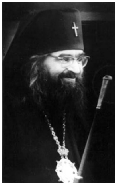
un santo contemporaneo: san Giovanni Maximovich

sapiente secondo questo secolo, che diventi folle per essere saggio" (I Cor 3:18). Ma questa follia per Cristo è una croce pesante e non vi si impegnano altri che i più forti.