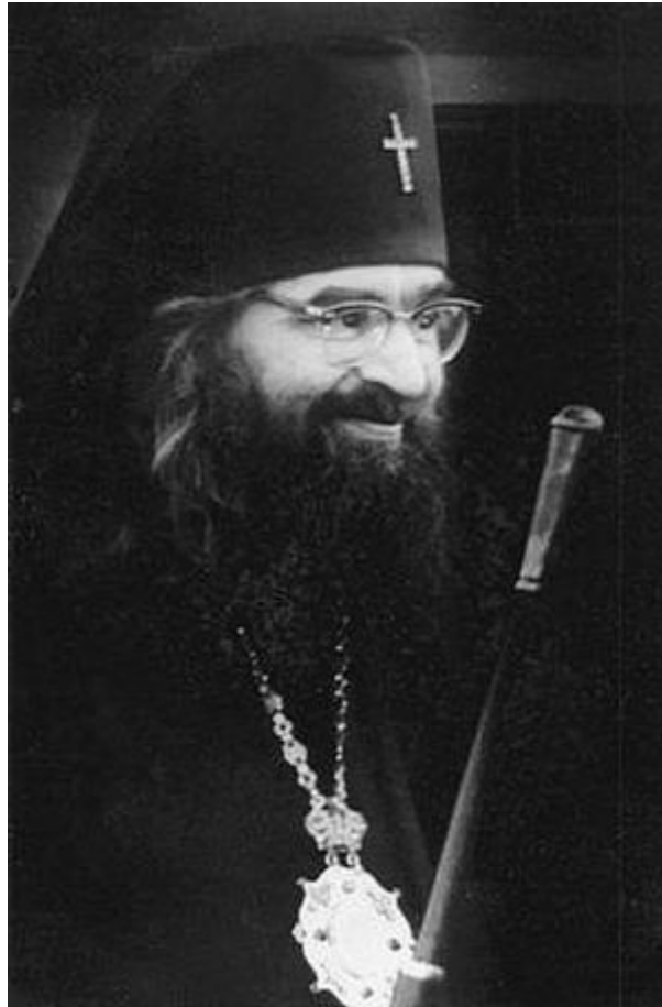
san Giovanni di San Francisco