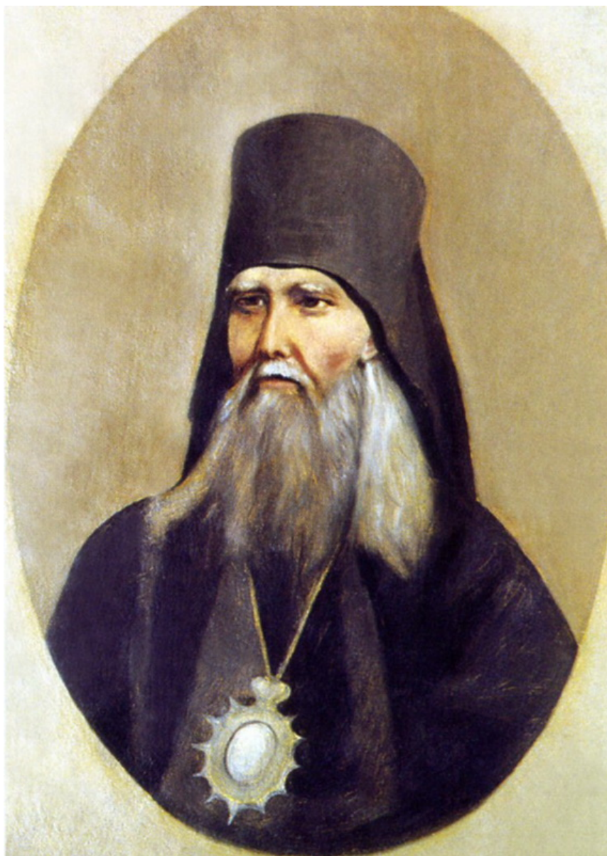
il vescovo Teofane il Recluso

Il vescovo Teofane il Recluso [1894], quando citava alcuni dei Santi Padri, ometteva deliberatamente molti dei passi che trattano degli aspetti fisici della preghiera. Lo ha fatto sapendo che - anche ai suoi tempi, nel XIX secolo - molti avrebbero preso quegli aspetti fisici come un fine e avrebbero iniziato a imitare senza ottenere l'essenza. Quindi lasciò fuori quegli scritti dalle sue opere pubblicate. Ora, però, molti di loro sono in corso di