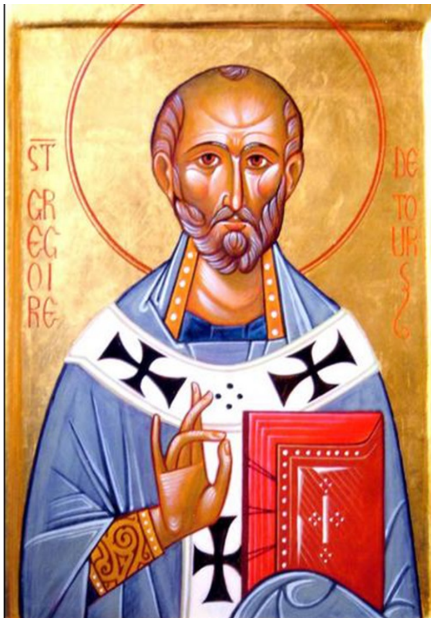
san Gregorio di Tours

C'è un libro molto interessante dello stesso periodo di abba Doroteo (VI secolo), di san Gregorio di Tours, la Storia dei Franchi , che è tutta dedicata alla vita alla corte di quel tempo e tra le persone religiose. Ci sono molte vite interessanti di santi in essa, così come vite dei re. I re di quel tempo erano spettacoli molto poco edificanti. Cercavano costantemente di avvelenarsi a vicenda. Le donne erano anche peggio... C'erano una certa Brunilde e sua sorella Fredegonda che cercavano di far salire i loro figli e nipoti sul trono, e cosa non hanno fatto per farlo! Facevano trascinare delle persone attaccandole alle code dei cavalli e le uccidevano, e mentivano e imbrogliavano e facevano cose simili, ben poco edificanti. Ma questo vescovo, san Gregorio, era lì e stava scrivendo una storia di questo popolo, scrivendo in modo tale che in realtà appare molto stimolante. Dietro tutto ciò c'è un significato. San Gregorio è costantemente alla ricerca di comete, terremoti e cose del genere. Quando un re fa qualcosa di sbagliato, accade nei dintorni un terremoto, o se uccide una persona o un intero villaggio ingiustamente, allora c'è una carestia: e san Gregorio vede sempre che Dio sta osservando. C'è sempre qualcosa di spirituale ogni volta che succede qualcosa, si osserva una cometa, un re muore, ecc. C'è sempre una connessione tra ciò che accade nel mondo e lo stato morale del popolo. Anche quando lo stato morale è molto