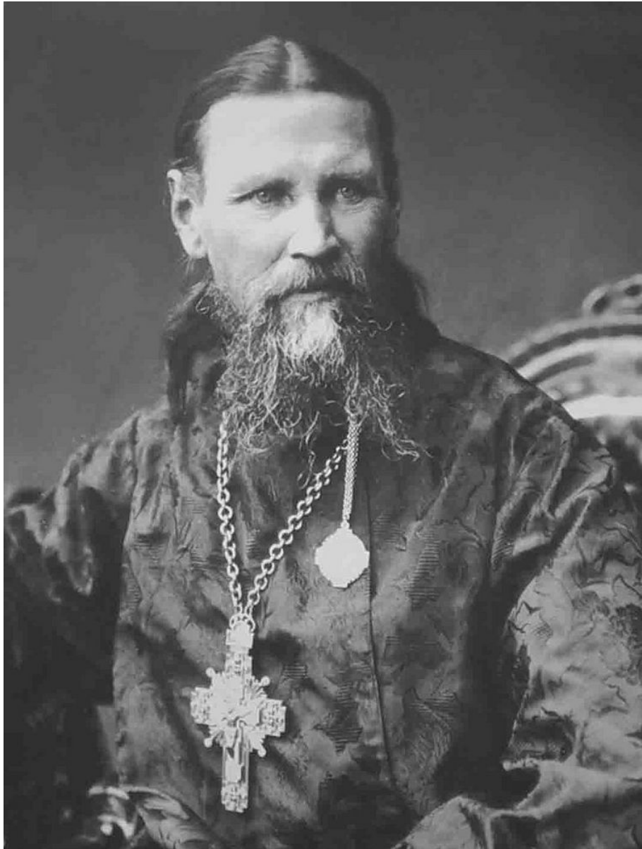
san Giovanni di Kronstadt

I santi Padri hanno parlato degli ultimi tempi come di momenti di grande debolezza, in cui non vi saranno i grandi segni compiuti nei primi tempi degli apostoli e nel deserto dai primi monaci, laddove si operavano migliaia di miracoli, grandi Padri facevano risorgere persone dai morti e accadevano molti eventi soprannaturali; e questi stessi santi Padri hanno detto che questa abbagliante epoca di miracoli sarebbe svanita, e alla fine non ci sarebbe stato quasi nulla di simile. Infatti, coloro che si salvano sembrerebbero del tutto indistinguibili da tutti gli altri, tranne che in qualche modo mantengono viva la lotta contro tutte queste tentazioni. Solo mantenere viva la scintilla della vera fede cristiana, senza fare miracoli senza fare nulla di straordinario, già li avrebbe resi, se perseveravano sino alla fine, altrettanto grandi o addirittura superiori a quei grandi Padri che operavano miracoli.