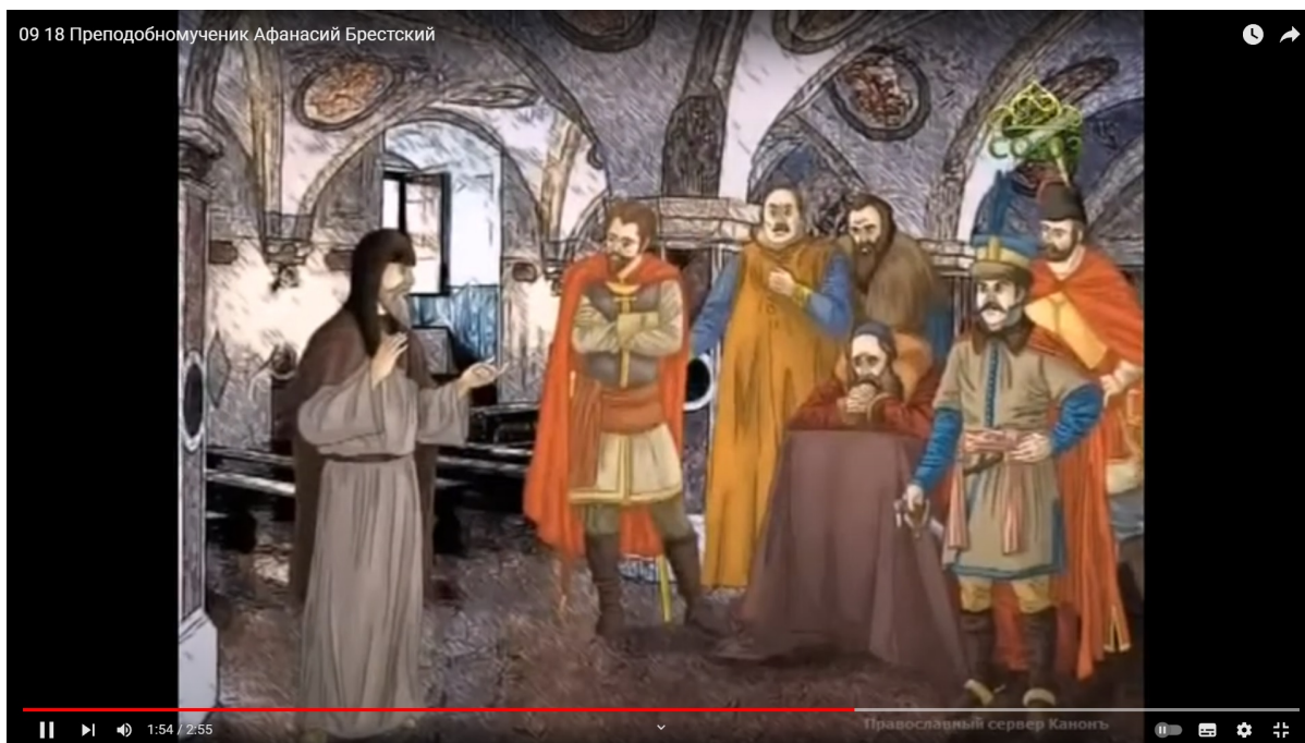
una breve video-biografia di sant'Atanasio di Brest per i più piccoli

Profondamente religioso, inesorabilmente devoto alla fede dei santi Padri, fu disposto a lottare fino alla morte per il suo scopo: ristabilire l'Ortodossia nelle antiche terre russe. Il suo ripudio dell'Unia non lo portò mai tuttavia a mancare di compassione e di amore verso quelli che erano rimasti vittime della complicità uniate. La sua rettitudine e sincerità si rispecchiavano nella sua predizione profetica: "L'Unia si estinguerà, ma l'Ortodossia fiorirà".