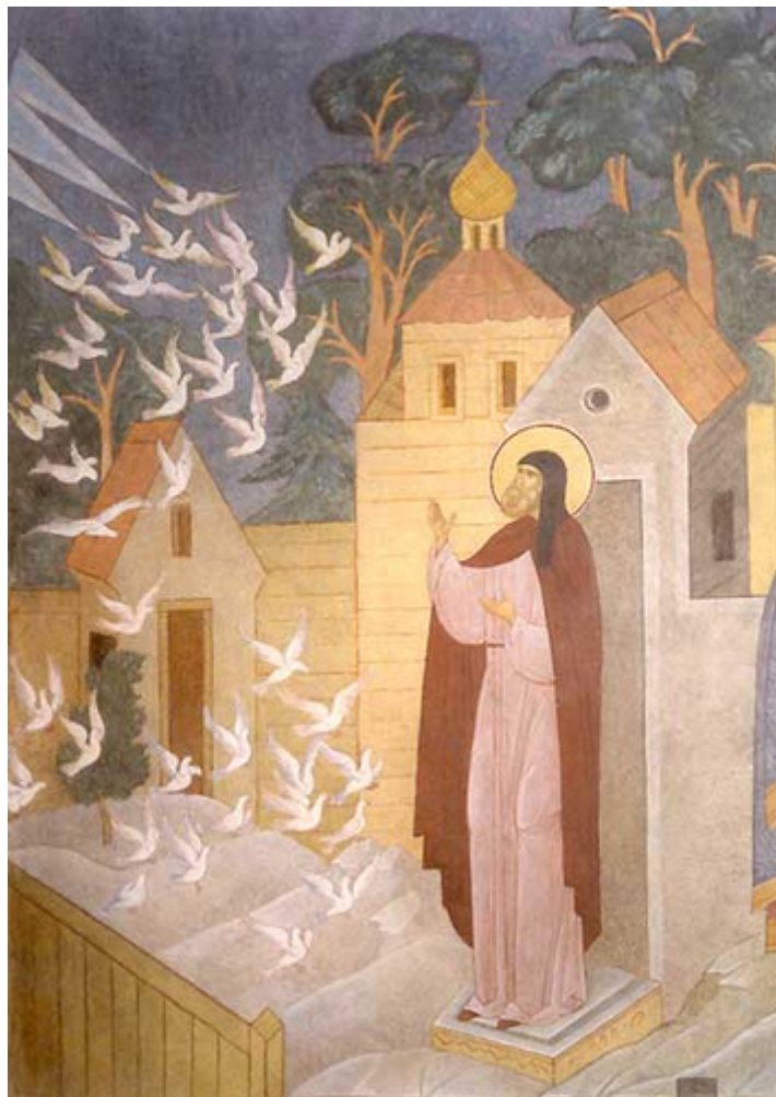
san Sergio e la visione degli uccelli

Sebbene l'autore della Vita di san Sergio , Epifanio il Saggio, mancasse dell'articolazione teologica per attirare la nostra attenzione su questa sfaccettatura della vita interiore del santo, non vi è dubbio che vi siano effettivi cenni alla luce taborica. Vale la pena citare per intero alcuni dei racconti delle visioni del fuoco celeste e dei concelebranti angelici alla Divina Liturgia, quest'ultimo essendo un segno preciso dell'elevato livello di santificazione di una persona. Dobbiamo tenere presente che è impossibile descrivere accuratamente la gloria increata di Dio in termini umani. Il primo esempio è la visione della luce divina testimoniata da San Sergio: