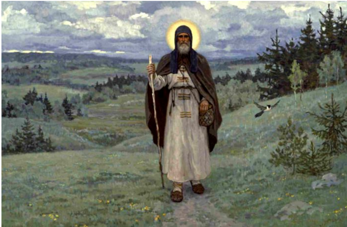
san Sergio di Radonezh

del monaco Theodore (Stanway) OrthoChristian.com , 18 luglio 2020