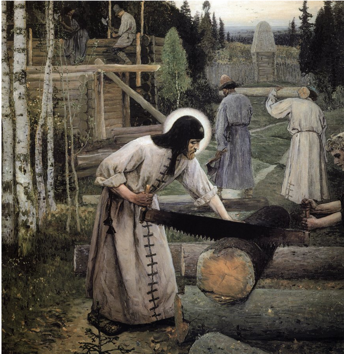
M. N. Nesterov, le fatiche di san Sergio

Sebbene San Sergio e i suoi monaci lavorassero alla loro salvezza nel quadro di una comunità cenobitica, bilanciando il duro lavoro con la dedizione ai servizi divini della Chiesa, riuscirono comunque a mantenere alcune delle pratiche associate con gli esicasteri nella loro vita quotidiana. I monaci praticavano la rivelazione dei pensieri, che aveva luogo alla quarta ode del Canone, durante il Mattutino. [21] Il digiuno era severo e abbondano storie dei primi giorni della fratellanza, quando la scarsità di pane portava i monaci a restare senza cibo per giorni e giorni. San Sergio vietò ai suoi monaci di chiedere l'elemosina, il che alla fine portò a una ribellione da parte dei fratelli. Nonostante questa severità, la regola iniziale usata dai fratelli, quella del monastero di Studion, era stata in effetti rilassata da san Sergio, che diminuì le esigenze di rigidità e enfatizzò l'umiltà e la dolcezza. [22] Un'altra pratica locale, che evidenzia il ruolo paterno di san Sergio come guida dei suoi monaci lungo lo stretto sentiero, erano le sue ispezioni notturne delle celle monastiche dopo la Compieta. Dopo aver completato la propria regola nella cella, andava in giro per le celle degli altri fratelli, rallegrandosi se i monaci all'interno stavano pregando e facendo prosternazioni, leggendo libri spirituali o piangendo sui loro peccati e bussando alle porte se sentiva i monaci conversare o ridere. La mattina seguente, i monaci che lo avevano deluso erano