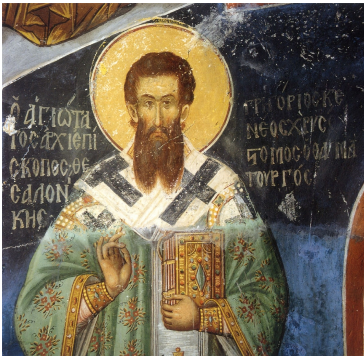
san Gregorio Palamas

Questi monaci furono anch'essi noti per vedere la gloria increata e riferirono obbedientemente queste rivelazioni al santo. [27] Questo è esattamente ciò a cui si riferisce san Dionigi l'Areopagita quando scrive su "energia divina" e "raggi della divinità" e su ciò si espande san Gregorio Palamas quando scrive "La luce divina non ha solo un significato allegorico e astratto: è il fatto dell'esperienza mistica". [28]