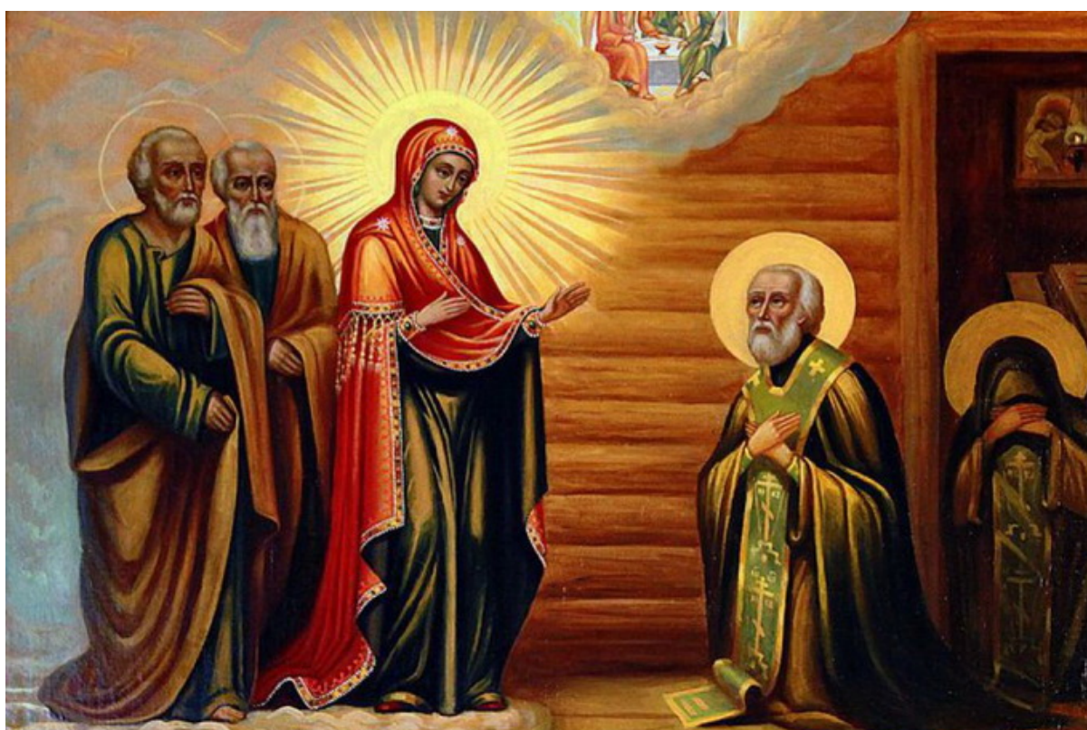
l'apparizione della Madre di Dio a san Sergio

apostoli, Pietro e Giovanni, in una luminosità indescrivibile. E quando il santo li vide, si prosternò, non potendo sopportare la luce. La tutta pura toccò il santo con le sue mani e disse: "Non essere terrorizzato, mio eletto, sono venuta a trovarti. La tua preghiera per i tuoi discepoli per i quali hai pregato e per la tua dimora è stata ascoltata. Non dovrai più preoccuparti, perché d'ora in poi ci sarà tutto in abbondanza e non solo finché vivrai, ma anche dopo la tua dipartita al Signore non lascerò mai il tuo rifugio, fornendo generosamente tutto il necessario e proteggendo i donatori". E detto questo, divenne invisibile. Il santo rimase in estasi mentale e fu preso da grande timore e tremore. Dopo un po' si rialzò da solo, trovò il discepolo che giaceva impaurito come se fosse morto e lo sollevò. Ma questi cadde davanti ai piedi dell'anziano, dicendo: "Spiegami, padre, per amore del Signore, cosa è stata questa meravigliosa visione, perché il mio spirito si è quasi separato a causa di quella visione radiosa." Il santo, che esultava nella sua anima in modo che tutta la sua figura sbocciava di gioia, poté solo rispondere: "Sii paziente, figlio mio, poiché anche il mio spirito trema dentro di me per questa visione meravigliosa".