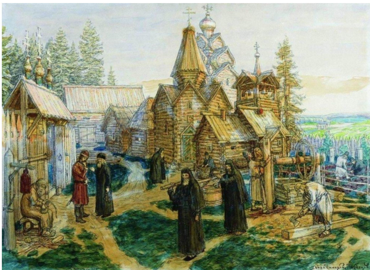
A. M. Vasnetsov, il monastero di san Sergio durante la sua vita

Con un potenziale accesso a scritti così profondi, così a come incontri regolari con i monaci che compivano lotte ascetiche nei monasteri locali, possiamo immaginare che lo sviluppo spirituale del giovane san Sergio potrebbe essere stato pesantemente influenzato e informato dalla tradizione esicasta della Chiesa. Ciononostante, Fedotov sostiene che non sarebbe stato possibile per il giovane santo acquisire una sufficiente conoscenza della letteratura ascetica e degli scritti patristici all'età in cui era partito per la foresta. [13] Tuttavia, ciò che è impossibile per l'uomo è certamente possibile per Dio e l'impulso spirituale che san Sergio ha avuto fin dalla sua giovinezza potrebbe certamente compensare la sua mancanza di conoscenza in queste materie.