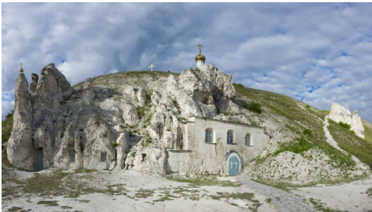
monastero della santa Dormizione di Divnogorsk

apprezzati dai fedeli in fuga dalle persecuzioni religiose. Esistono numerosi esempi in Montenegro, Bulgaria, Turchia, Georgia e Crimea. Nella Russia sud-occidentale, diversi monasteri furono scolpiti nella roccia calcarea nel XVIII e XIX secolo. Sono tutti sopravvissuti fino ai nostri giorni. È interessante notare che questi monasteri rupestri non furono costruiti da monaci ma da devoti cristiani che cercavano la vita solitaria e la preghiera. Nelle grotte calcaree della regione russa di Voronezh sono ancora attivi tre monasteri: il Kostomarovskij Spasskij, il monastero della santa Dormizione di Divnogorsk e il monastero della santa Resurrezione a Belgorod.