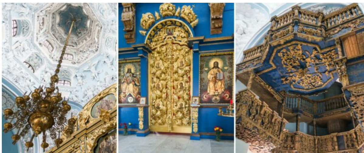
frammenti dell'iconostasi, cupola e galleria del coro all'interno della chiesa dell'Icona della Madre di Dio del Segno