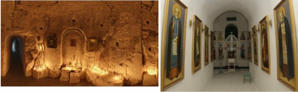
grotte di Divnogorsk e Belogorsk, vista interna

Questi esempi sfidano la nostra idea convenzionale dell'architettura, ecclesiastica o secolare. Alcune strutture sono costituite da un solo muro esterno e l'arredamento interno dipende quasi sempre dalla forma degli interni. A volte, tuttavia, i migliori architetti hanno reso il design degli interni quasi indistinguibile da quello una chiesa convenzionale.