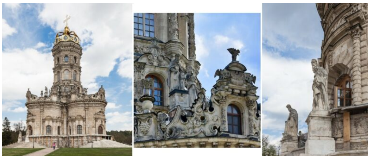
la chiesa dell'Icona della Madre di Dio del Segno

sovietiche la chiusero, facendo saltare in aria il campanile e all'interno la chiesa dei santi Adriano e Natalia.