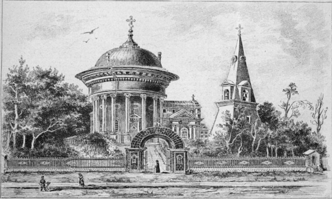
Соборъ Св. Троицы (Куличъ и Пасха), въ селѣ «Александровскомъ», на берегу Невы (Спб. губ.).

la chiesa della santa Trinità "Kulich e paskha": il progetto originale