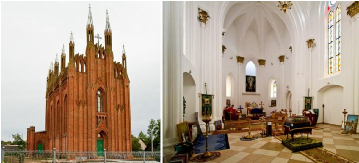
la chiesa della Dormizione della Madre di Dio