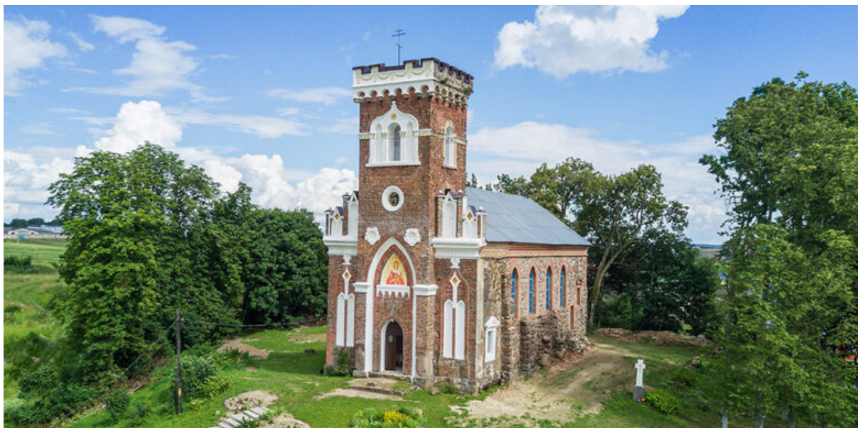
la chiesa di santa Barbara a Raets, Bielorussia