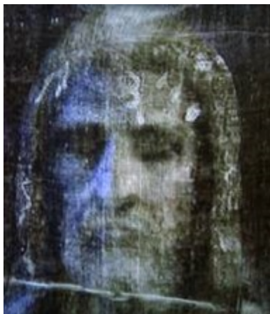
una ricostruzione tridimensionale del volto sulla Sindone di Torino