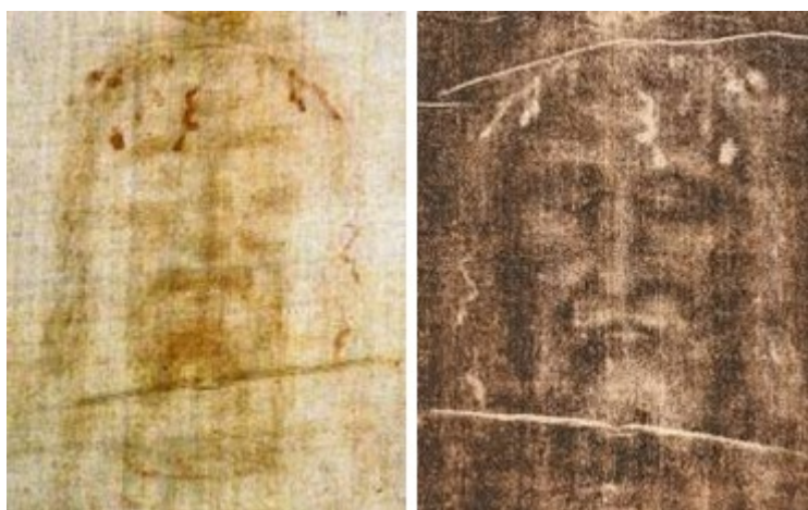
il volto del Salvatore sulla Sindone di Torino, positivo e negativo