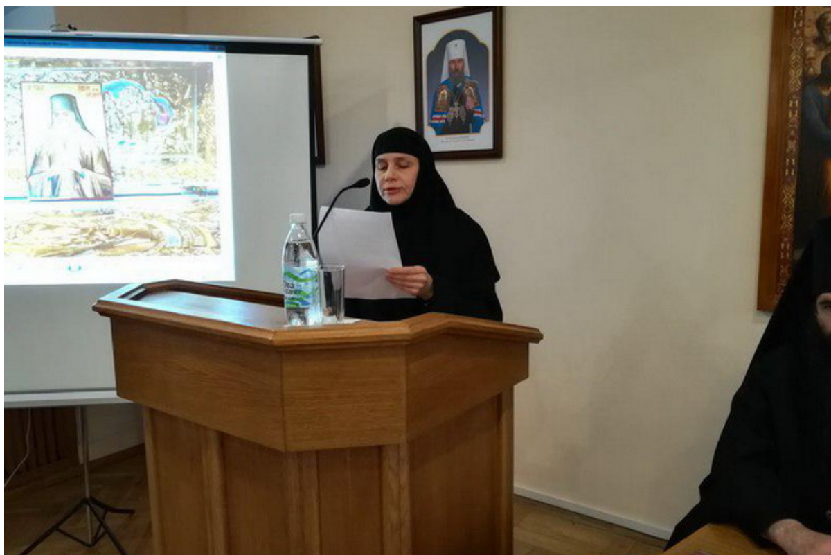
la monaca Serafima (Konstantinovskaja)

Dona riposo, o Signore, all'anima del tuo servitore defunto, il nostro padre e maestro, metropolita Kallistos!