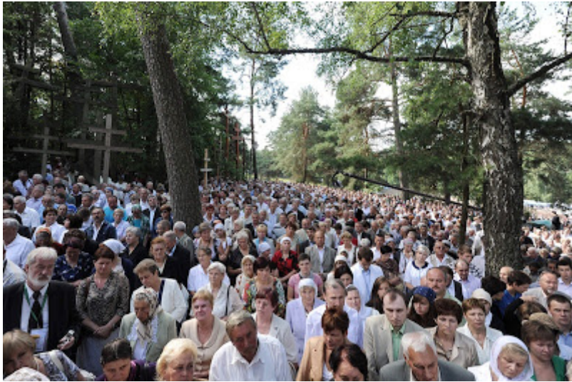
Sito del monastero di Grabarka