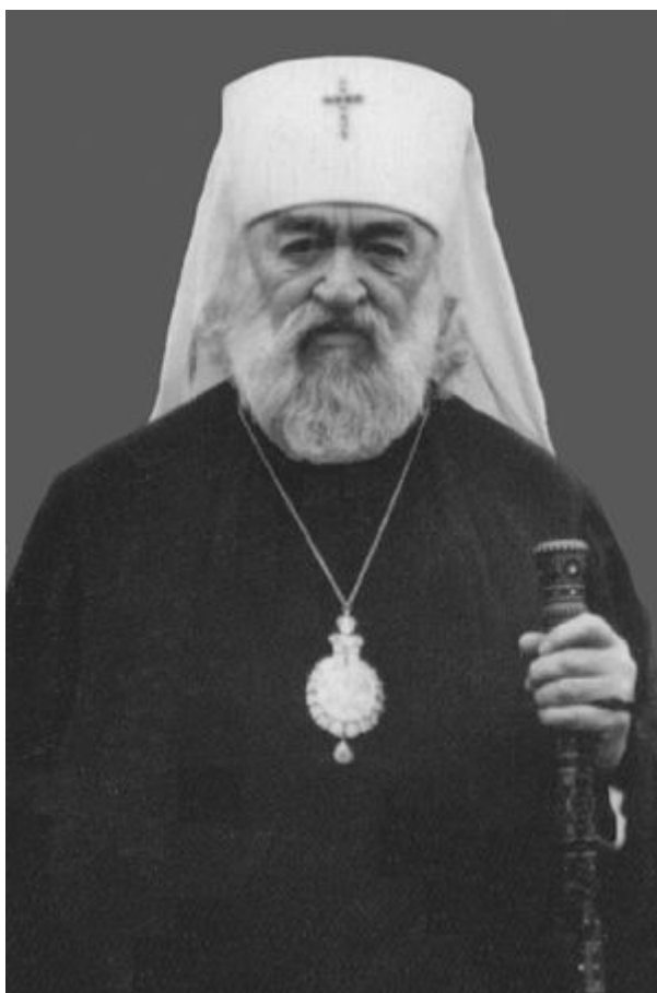
Il metropolita Nestor di Novosibirsk e Barnaul. Foto del 1956

Appesantito da numerose malattie e mezzo cieco, il metropolita Nestor trovò la forza di predicare la parola di Dio non solo nelle più grandi città della diocesi (Novosibirsk, Krasnojarsk, Tomsk, Kemerovo, Barnaul, Bijsk, Kyzyl, e Achinsk), ma anche nei boschi perduti e nei villaggi dove, come lui stesso diceva, nessun vescovo aveva mai messo piede, e la gente non aveva mai visto servire un vescovo. Ciò portò ad un notevole rinvigorismento della vita della Chiesa nella diocesi. Il metropolita Nestor protestò contro la chiusura delle chiese, e sollevò la questione di aprire nuove parrocchie e seminari teologici. La sua attività intensa portava estremo dispiacere alle autorità, e nuove persecuzioni furono organizzati contro l'arcipastore.