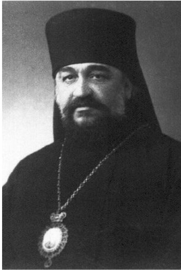
L'arcivescovo Nestor di Kamchatka. Foto del 1940

Nel 1933, fu elevato al rango di arcivescovo, e nel 1941 gli fu concesso il diritto di indossare una croce sul suo klobuk.