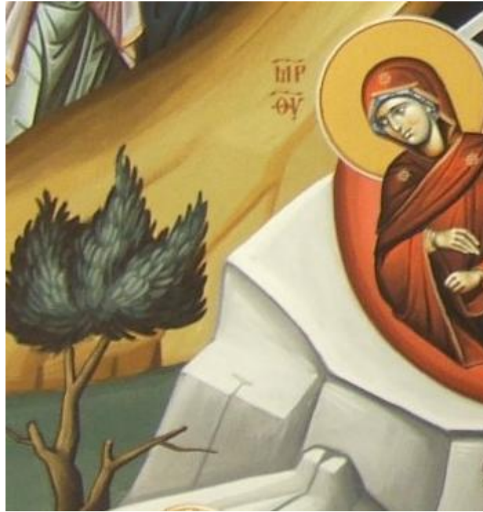
Maria guarda verso l'albero di Iesse

Un'altra cosa che si trova nella maggior parte delle icone della Natività è un "albero di Iesse" dal nome di un patriarca dell'Antico Testamento; la presenza dell'albero ci ricorda un'altra profezia di Isaia adempiuta: