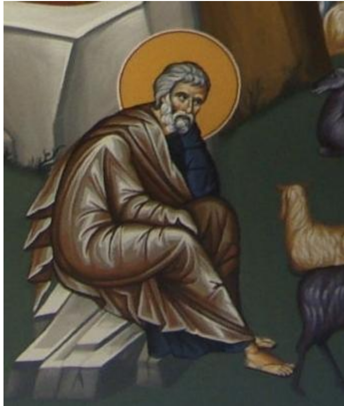
il giusto Giuseppe dall'aspetto turbato

Ma dov'è Giuseppe? A differenza dei ben noti presepi in Occidente, nelle icone ortodosse Giuseppe si trova di solito nella parte inferiore dell'icona, lontano dalla sua fidanzata e dal figlio. A volte lo si vede mentre sta ad ascoltare un uomo anziano, e sembra turbato. È preso da nuovi dubbi riguardo a questa nascita, e questi dubbi gli sono istigati da Satana sotto forma di un vecchio, come scrive il Protovangelo . Il diavolo suggerisce che se il bambino fosse veramente divino non sarebbe nato in modo umano. Questi argomenti, che alla fine non hanno fatto inciampare Giuseppe, sono sempre tornati a turbare la Chiesa, e sono alla base di molte eresie sull'identità di Cristo. Nella persona di Giuseppe, l'icona rivela non solo il suo dramma personale, ma il dramma di tutta l'umanità, la difficoltà di accettare ciò che è oltre la ragione, l'Incarnazione di Dio.