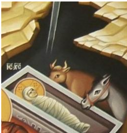
una profezia di Isaia adempiuta

L'umiltà delle origini di Cristo non dovrebbe sorprenderci, poiché le modalità della sua nascita erano state profetizzate molte centinaia di anni prima della manifestazione. La presenza del bue e dell'asino nell'icona della Natività adempie una delle tante profezie del libro veterotestamentario di Isaia: