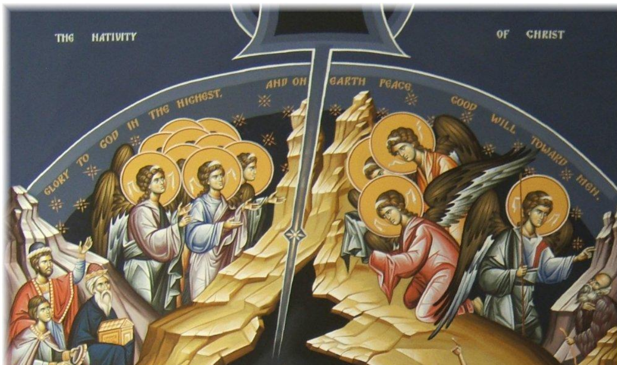
parte superiore dell'icona della Natività

Il Cristo bambino e sua madre sono raffigurati in una grotta, circondata da rocce impossibilmente nitide, inospitali, che riflettono il mondo crudele in cui Gesù è nato. Il Vangelo racconta che Giuseppe e Maria non riuscirono a trovare una camera in una locanda quando giunsero a prendere parte al censimento a Betlemme, e così Gesù fu deposto in una mangiatoia per animali. In quel tempo, gli animali non erano ospitati in stalle di legno, ma in grotte e anfratti nelle colline, e quindi questa "stalla" è mostrata nell'icona.