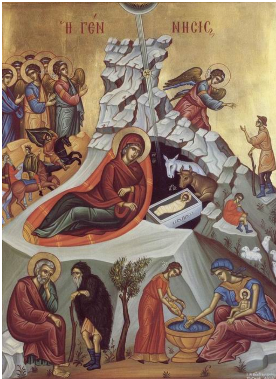
icona moderna della Natività

Il sapientissimo Signore viene alla nascita,