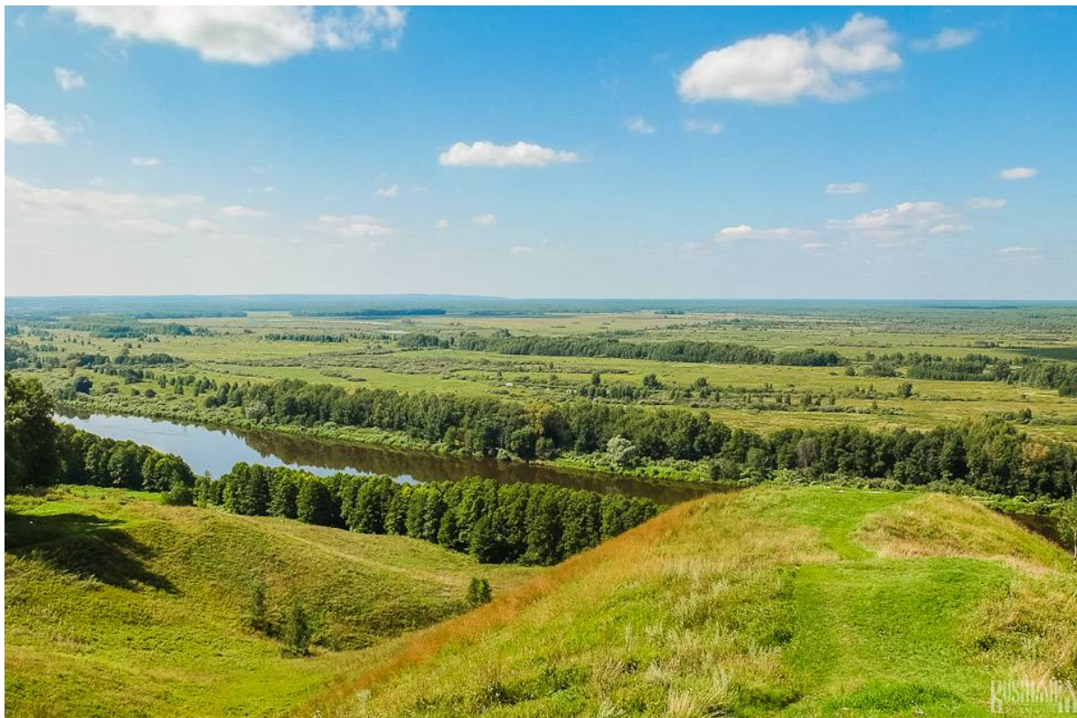
il Colle Calvo

Tra tutte le città che abbiamo visitato in Russia, Gorokhovets occupa un posto speciale. Qui vi è una perfetta combinazione di fascino provinciale e di uno splendido ambiente naturale. Non è sorprendente che Gorokhovets sia stata utilizzata come scenario per numerosi film storici, poiché sembra veramente che il tempo qui si sia fermato al XIX secolo. È un luogo ideale per trascorrere un week-end e dimenticare tutto il trambusto della vita moderna. In termini di infrastrutture turistiche, ci sono diverse case che offrono alloggio e un bell'albergo. Non c'è molta scelta in termini di ristoranti o bar in città, ma se non vi aspettate una cucina raffinata non dovrete rimanerne delusi.