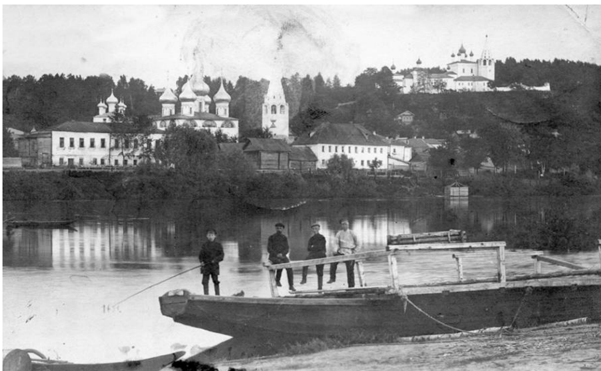
Gorokhovets. Inizi del XX secolo

È una veduta che non è cambiata drasticamente nel corso degli ultimi 300 anni.