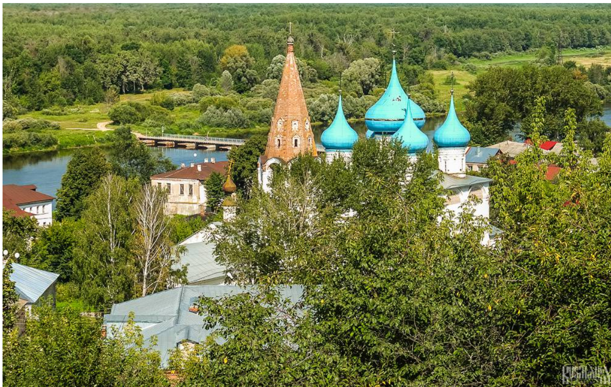
le cupole blu della cattedrale dell'Annunciazione

Da qui abbiamo attraversato il ponte di barche sul fiume Kljaz'ma per visitare il monastero Znamensky sull'altro lato del fiume. È possibile fare questa traversata solo in estate, quando c'è il ponte, oppure in inverno, quando il fiume è ghiacciato. Da questo lato del fiume c'è una vista mozzafiato sulla città, che appare come una scena di una fiaba russa: costruzioni in legno, chiese con cupole a cipolla e monasteri che si innalzano sopra il fiume su una pittoresca collina.