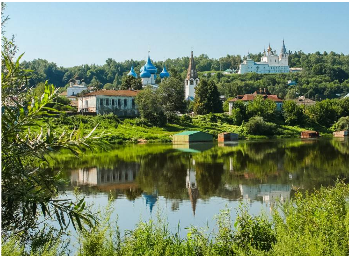
veduta della città dal fiume Kljaz'ma

È una veduta che non è cambiata drasticamente nel corso degli ultimi 300 anni.