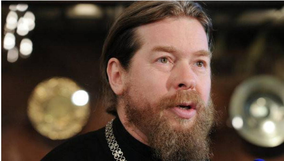
il vescovo Tikhon, uno dei chierici più importanti della Russia

La chiesa è finanziata dalla vendita del libro, dal monastero, e da donazioni da parte del pubblico. La costruzione è iniziata nei primi mesi del 2014, e la chiesa aprirà le sue porte nel marzo del 2017.