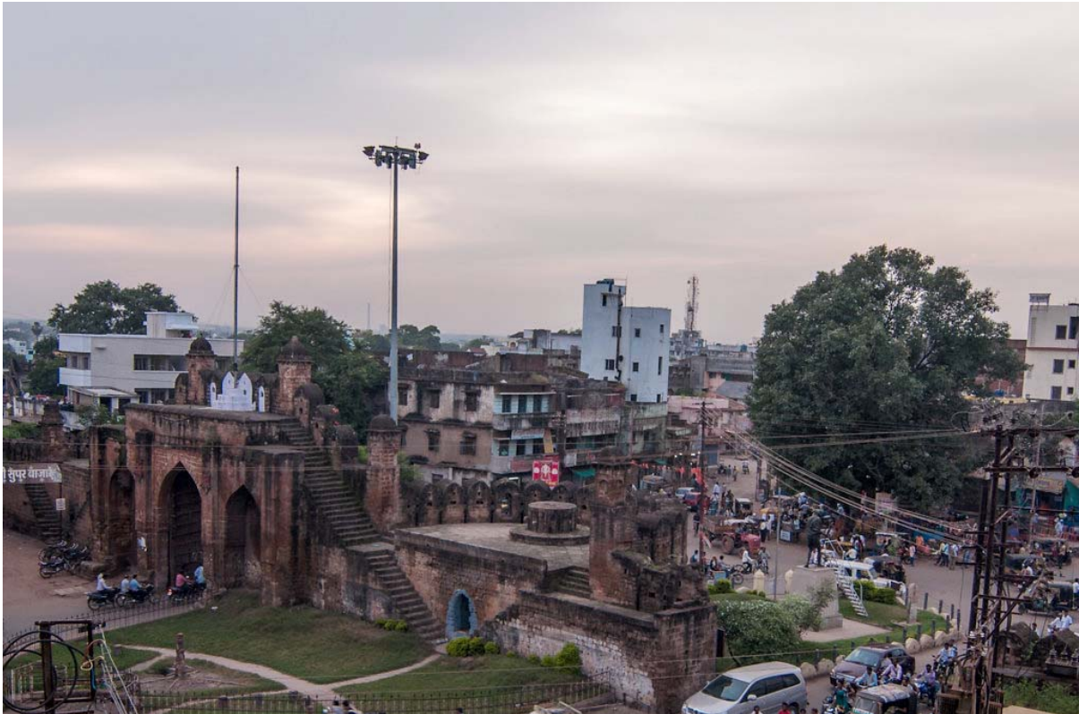
Chandrapur, India.

Sapeva che la nostra famiglia seguiva questa religione, strana e incomprensibile per la maggior parte degli indù. Eravamo anglicani e mio fratello era persino un pastore anglicano. Più tardi, nel 2012, sarebbe stato lui a scoprire la verità della fede ortodossa, prima per se stesso e poi per tutta la nostra famiglia.