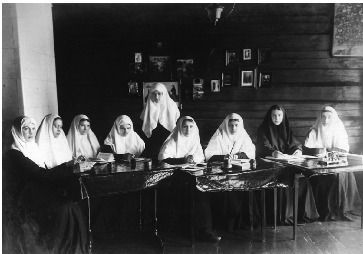
Monache che inseriscono nomi nei libri delle commemorazioni di preghiera al convento di Diveevo