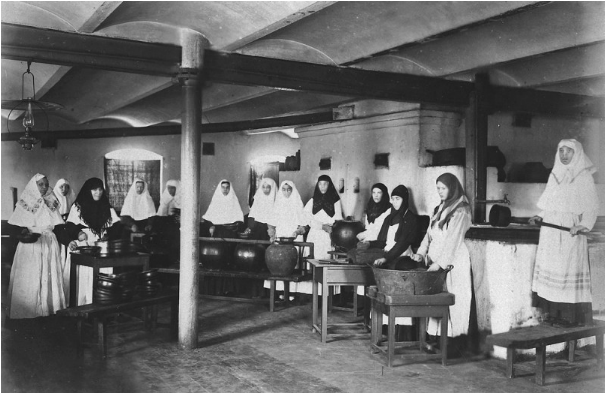
Sorelle al lavoro in cucina