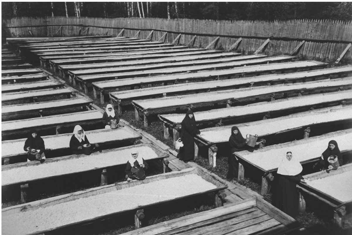
Preparazione della cera