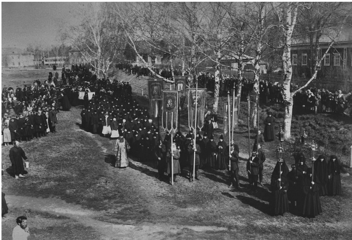
Processione della Croce al monastero di Diveevo