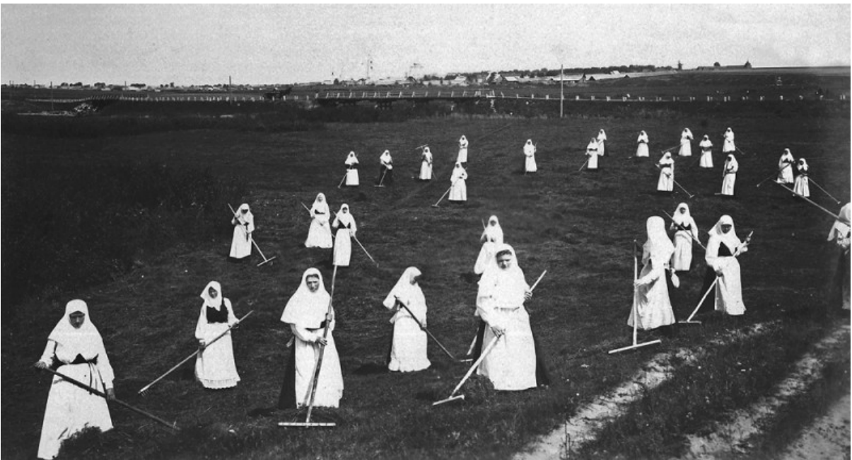
Sorelle che tagliano il fieno