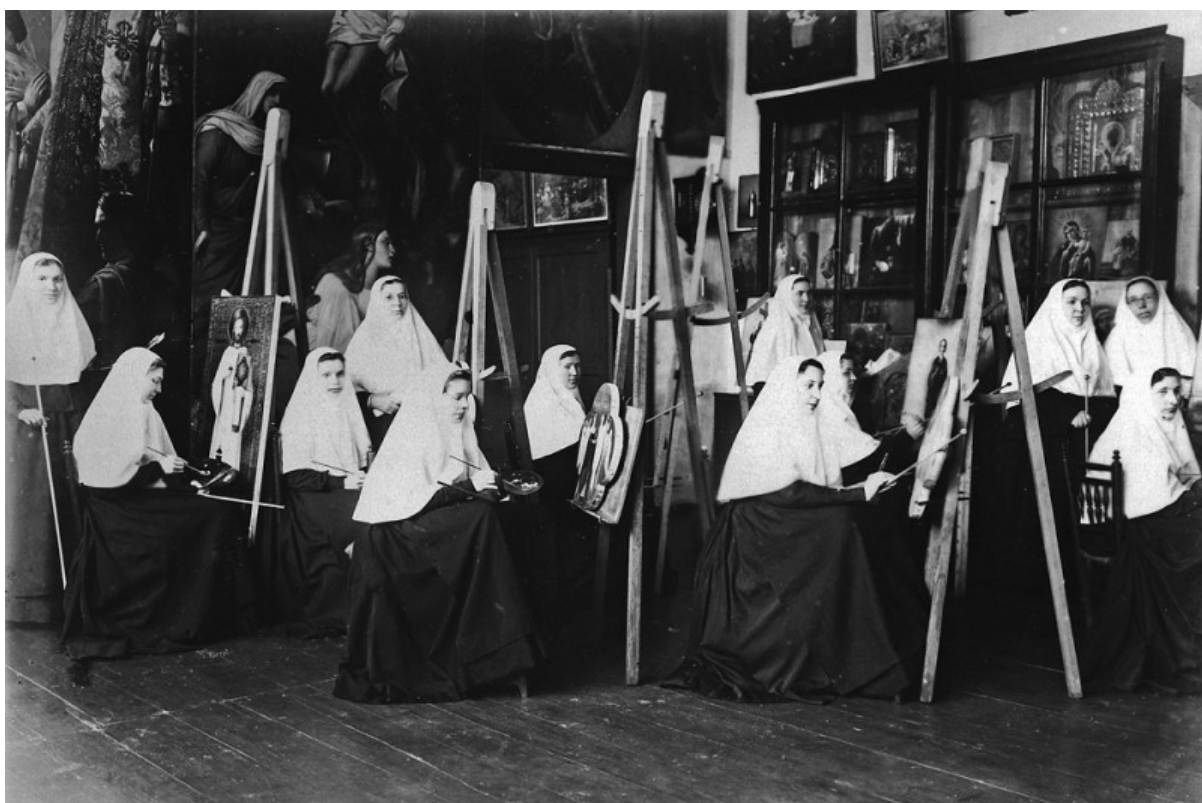
Pittura al convento di Diveevo