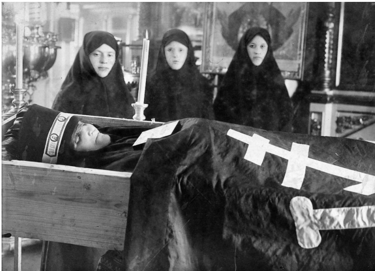
Il funerale di una monaca