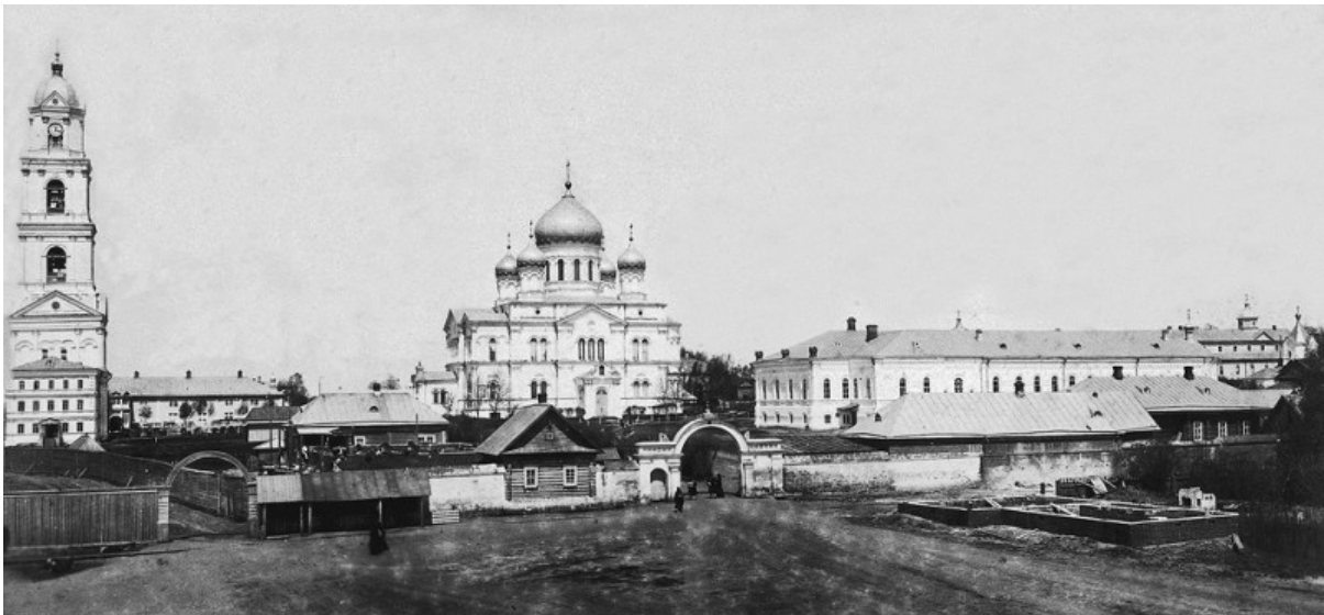
Veduta del monastero di san Serafino a Diveevo, dal lato meridionale