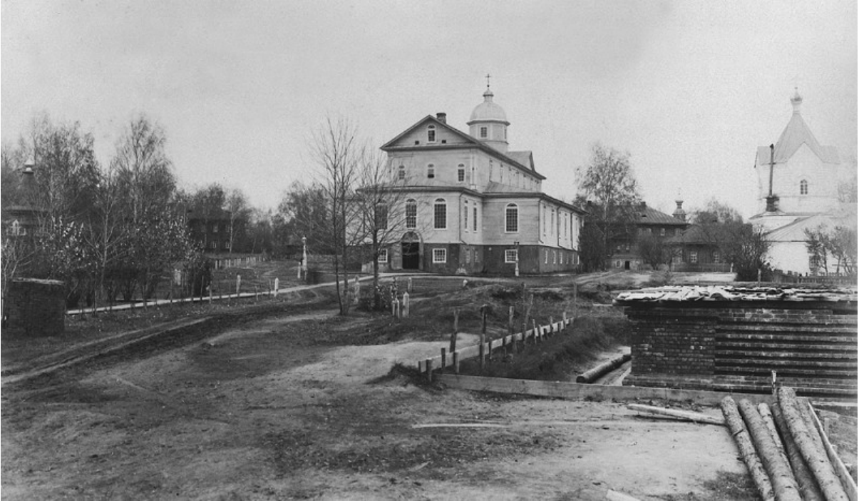
La Chiesa dell'icona della Madre di di Dio di Tikhvin