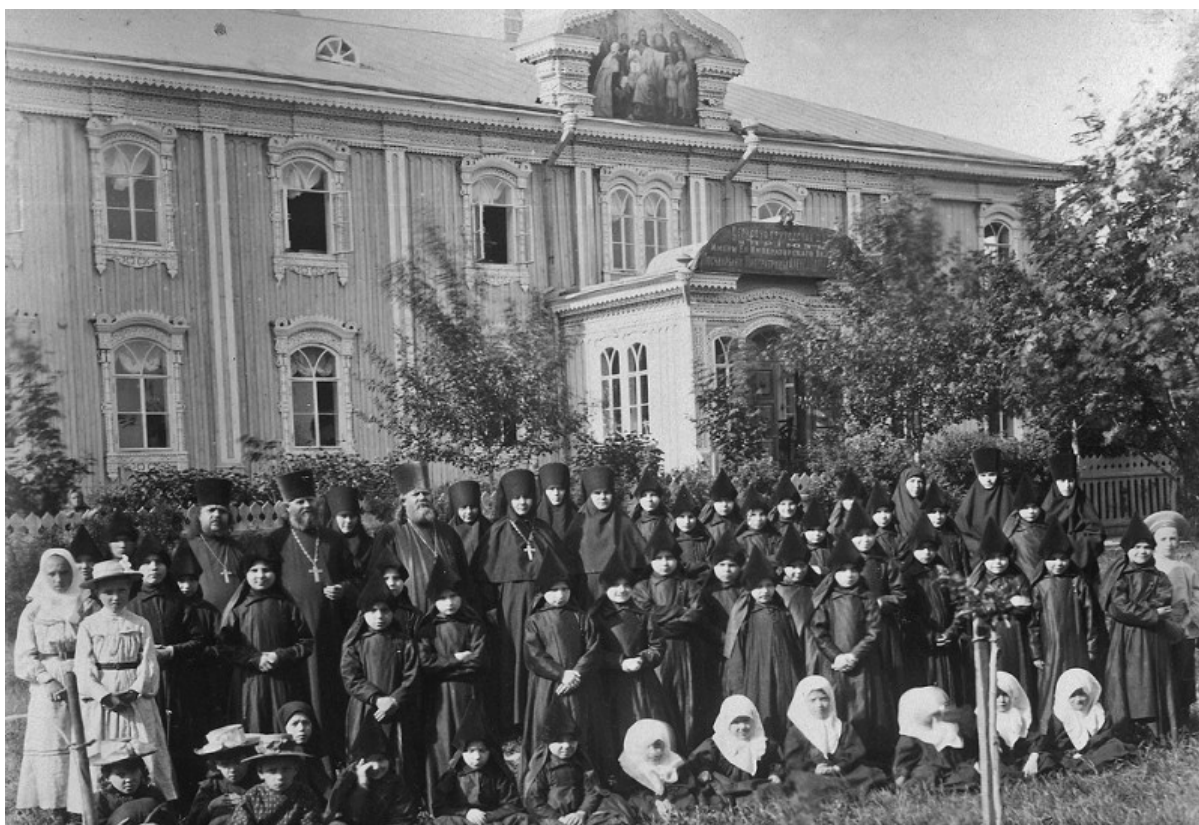
La scuola parrocchiale e l'orfanotrofio del monastero di Diveevo