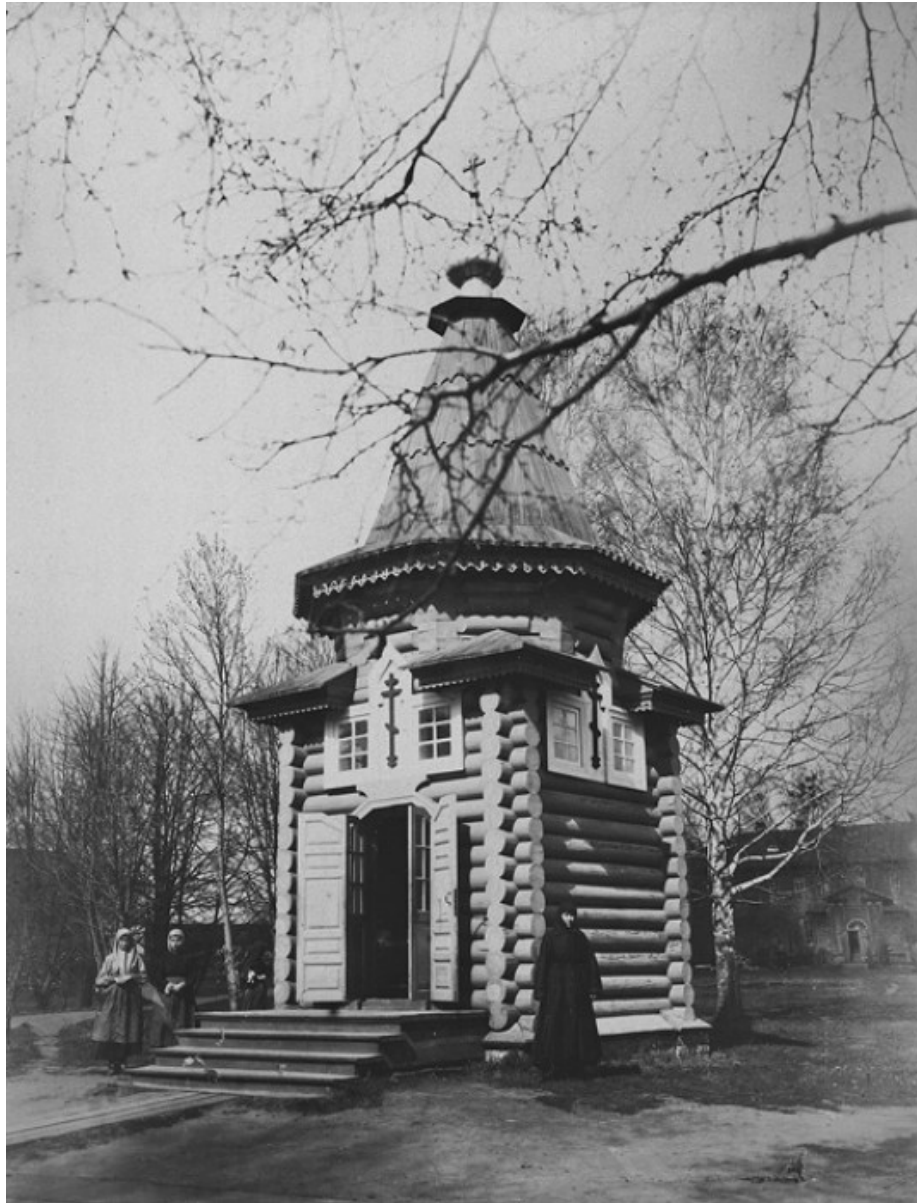
Una cappella sul luogo in cui fu costruito un mulino con benedizione di san Serafino