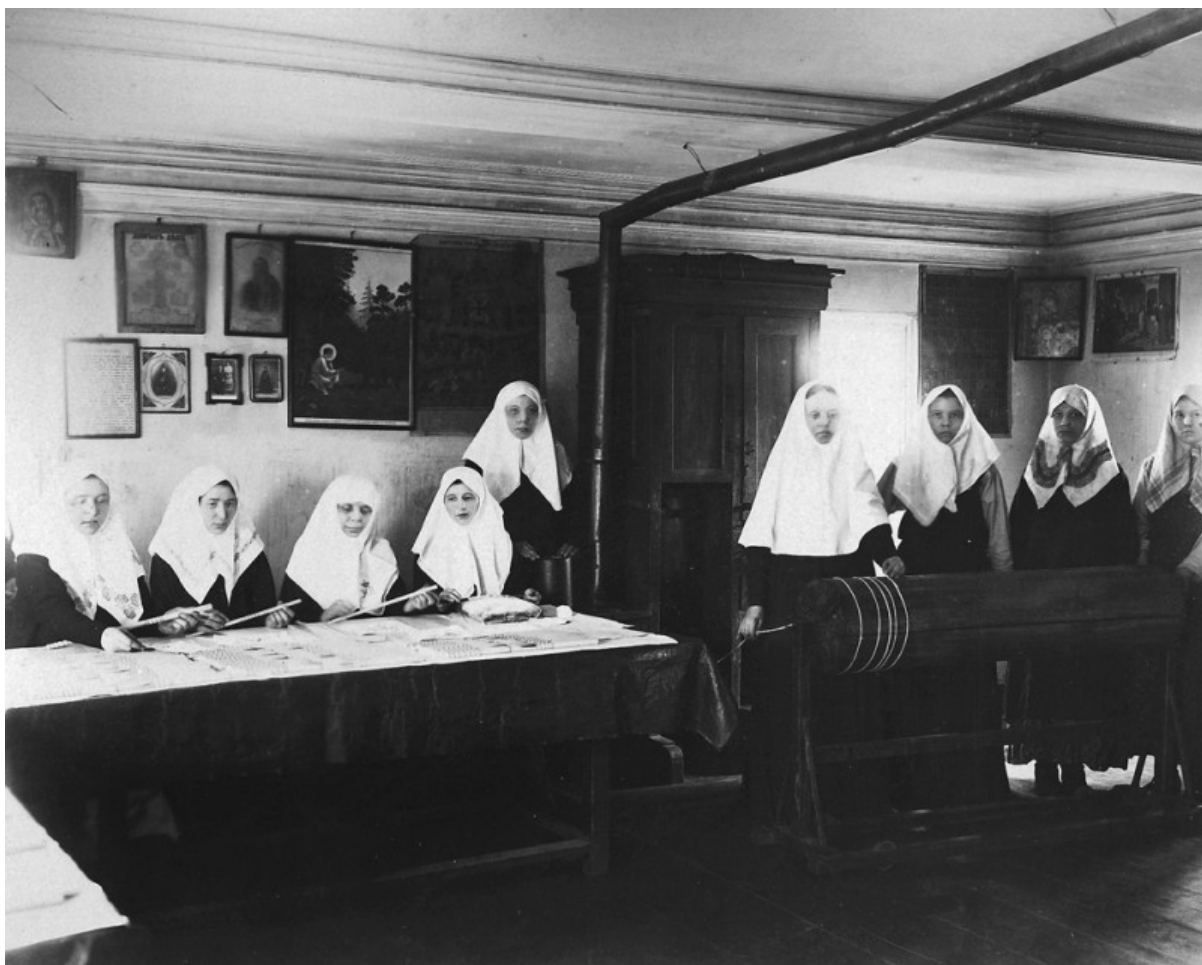
Fabbricazione di candele a Diveevo