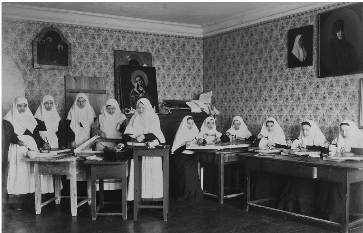
Sorelle che preparano icone in rilievo nel convento di Diveevo