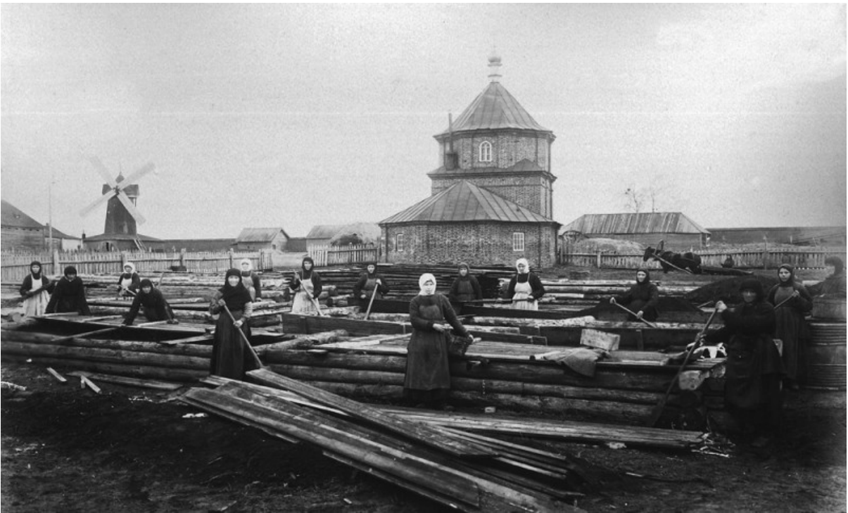
Sorelle al lavoro in giardino