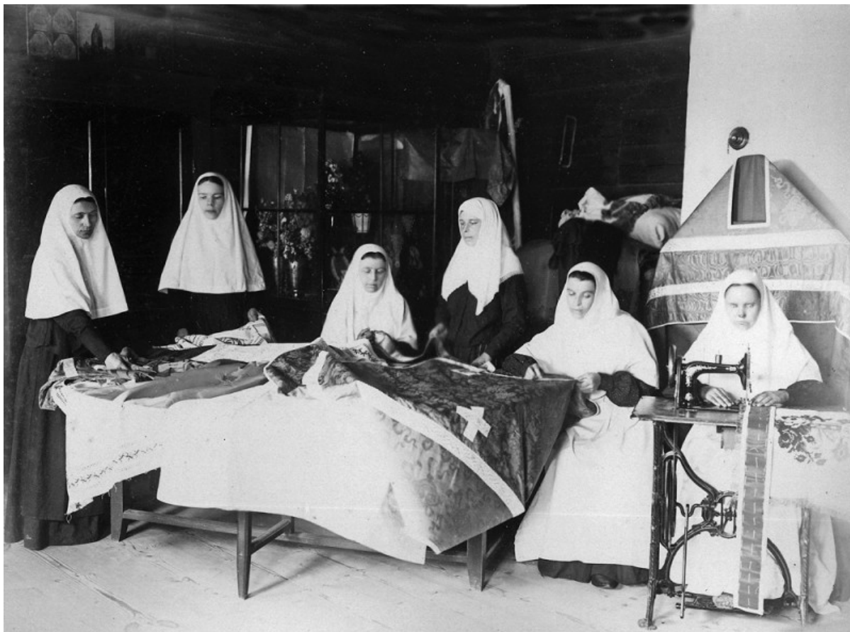
Cucitura dei paramenti al convento di Diveevo