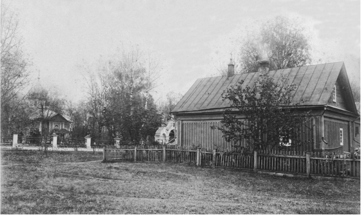
La chiesa della Trasfigurazione e l'eremo di San Serafino nel convento di Diveevo