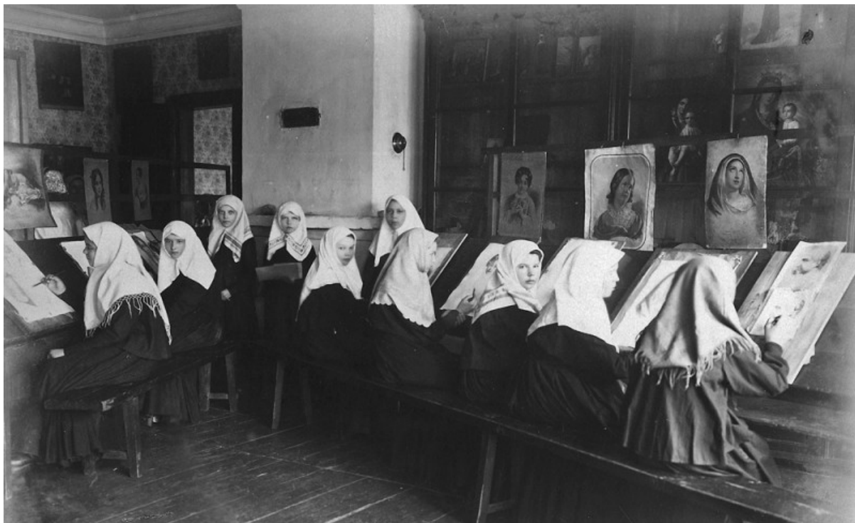
Disegni a Diveevo