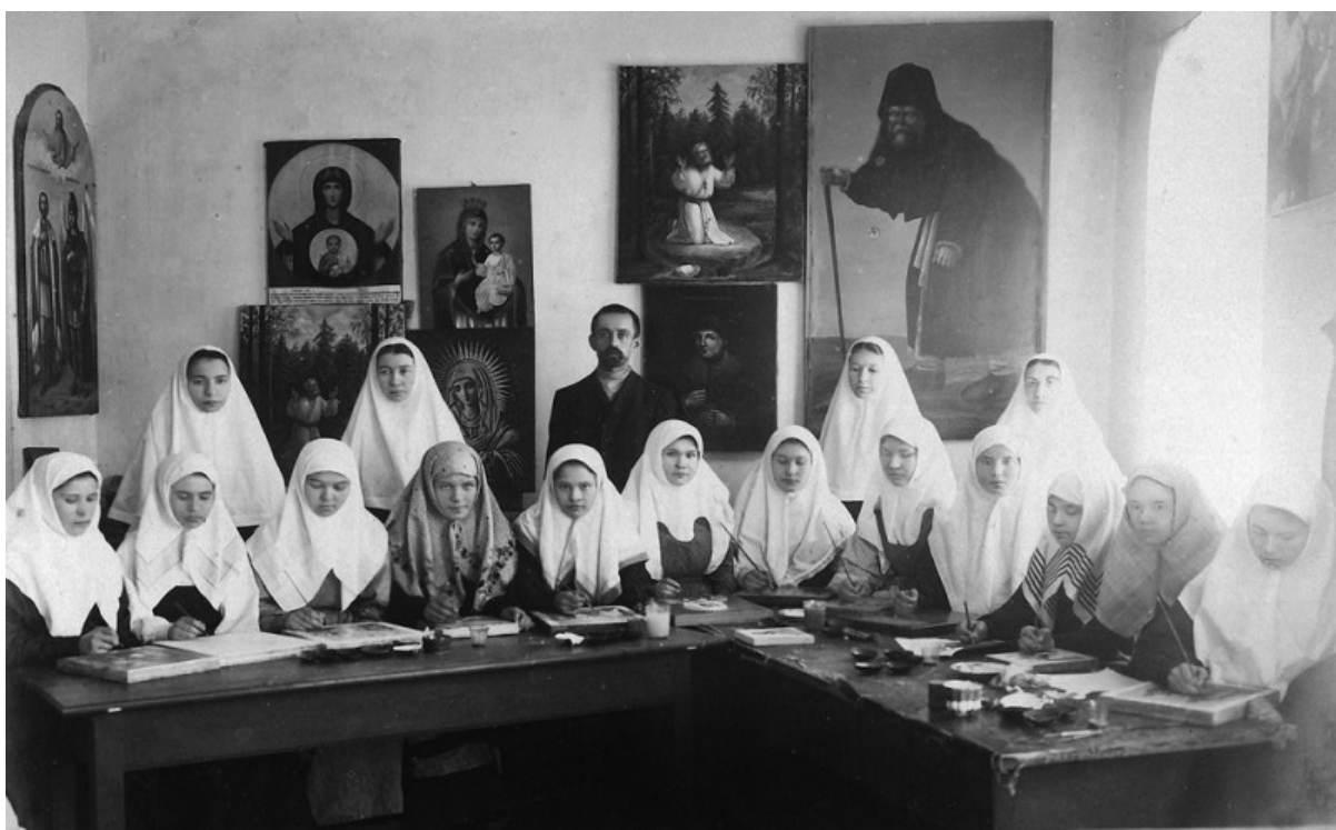
Pittura di icone al convento di Diveevo