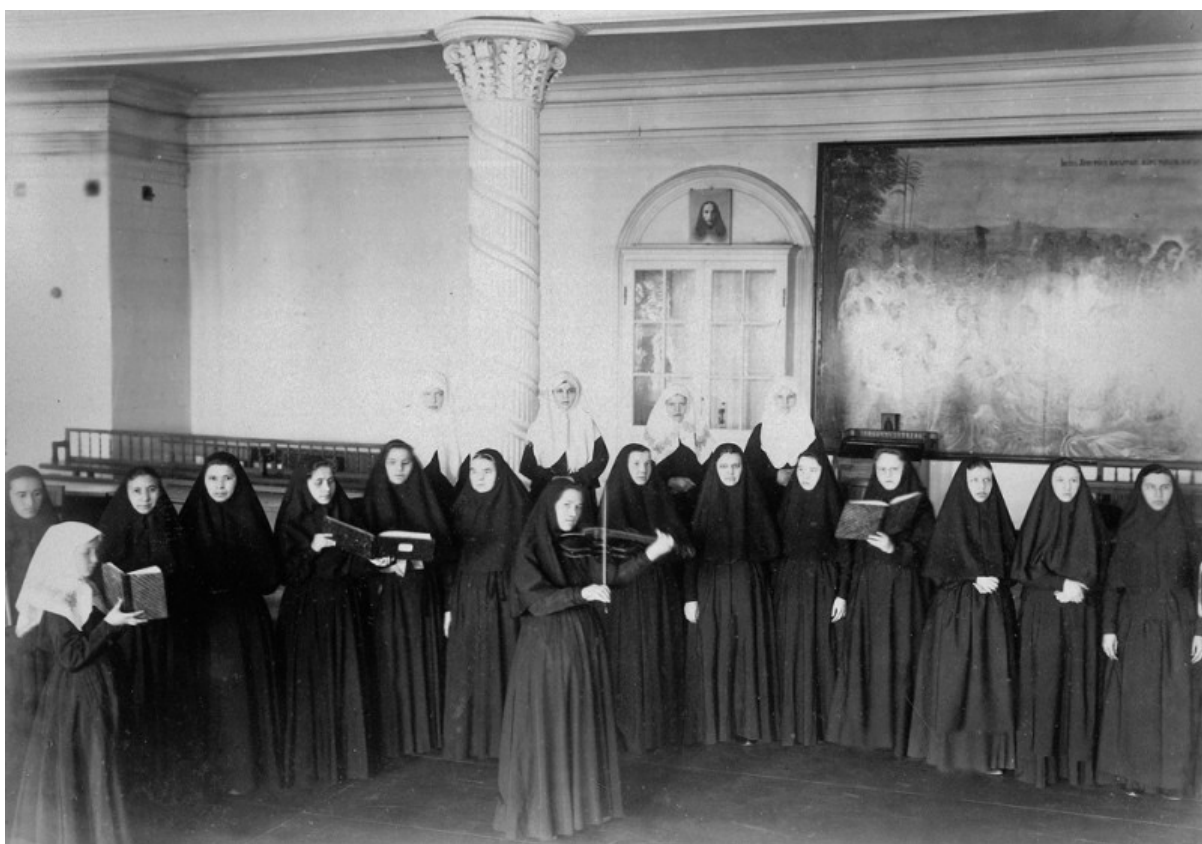
Il coro del convento di Diveevo