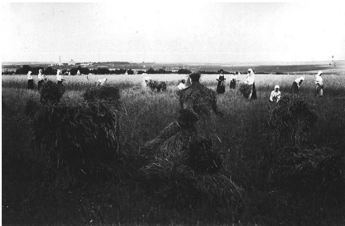
Sorelle al lavoro alla mietitura