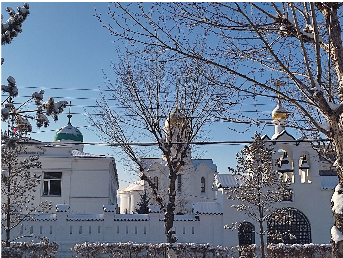
la chiesa della santa Trinità a Ulan Bator

E poi sono arrivato alla Chiesa ortodossa e sono rimasto lì. Sentivo che era casa mia.