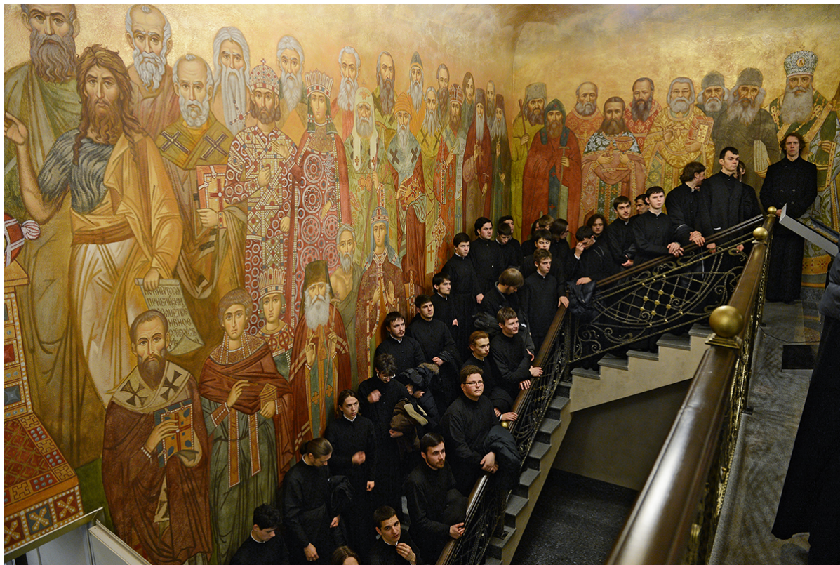
Gli affreschi del seminario Sretenskij.

Gli affreschi del Seminario Sretenskij raffigurano non solo tutti i santi russi, ma anche asceti che non sono ancora stati canonizzati, e vi è un ritratto di Fëdor Dostoevskij insieme a Nikolai Gogol'. Lei spesso parla dell'influenza che Fëdor Mikhailovich ha avuto su di lei, notando che è stato uno degli autori più cristiani della letteratura russa. Qual è la sua opinione sul ruolo della letteratura e dell'arte sullo sviluppo spirituale personale?