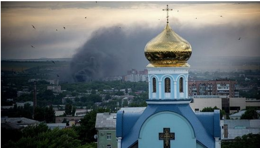
Il bombardamento di Lugansk. Vista dal campanile della chiesa