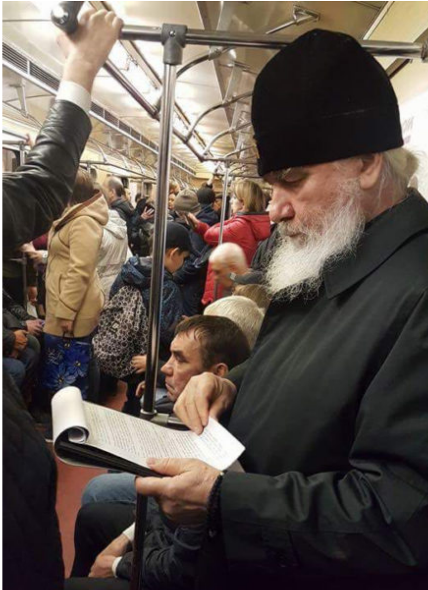
Pitirim, vescovo di Dushanbe e del Tagikistan, viaggia semplicemente a dorso di cammello.