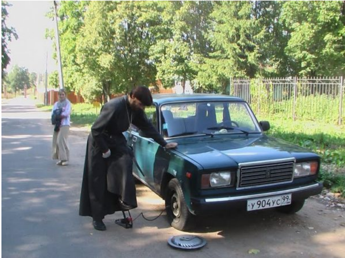
Il diacono più famoso della Russia sul suo mezzo di trasporto preferito.