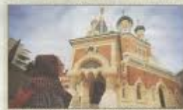
Les travaux de rénovation de la cathédrale, financés par la Russie, ont été inaugurés récemment.