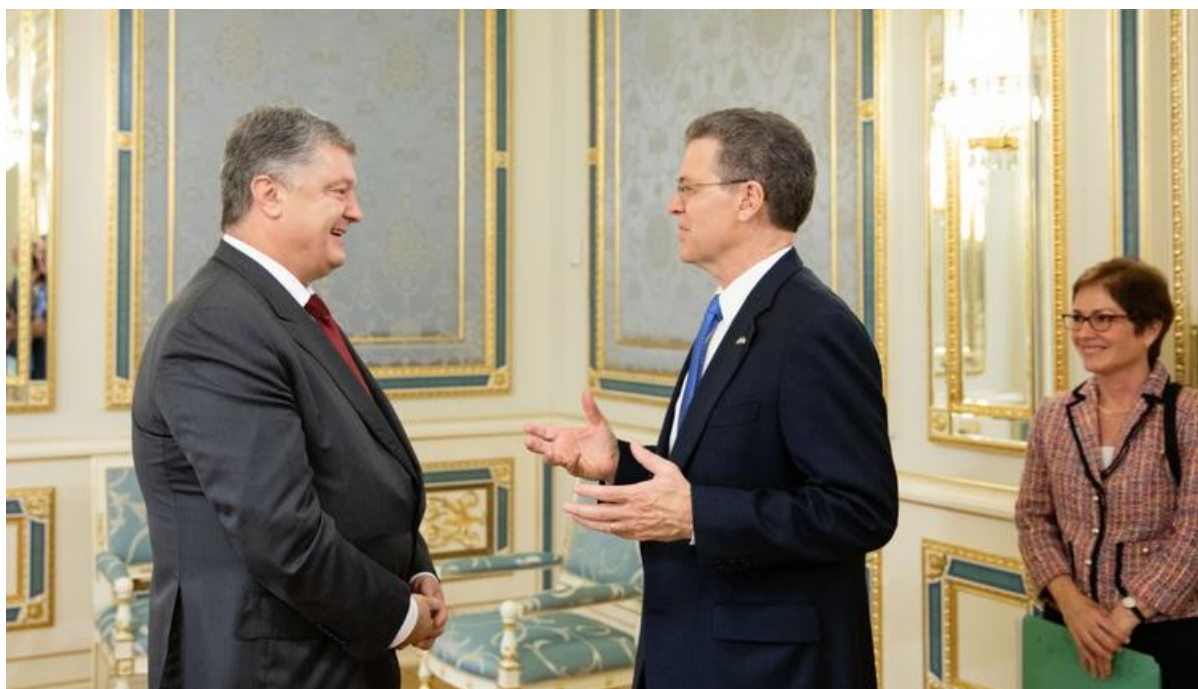
il presidente Petro Poroshenko e l'ambasciatore statunitense per la libertà religiosa, Sam Brownback

senatore, e nel 2008, ha persino concorso per la carica di presidente degli Stati Uniti nel partito repubblicano.