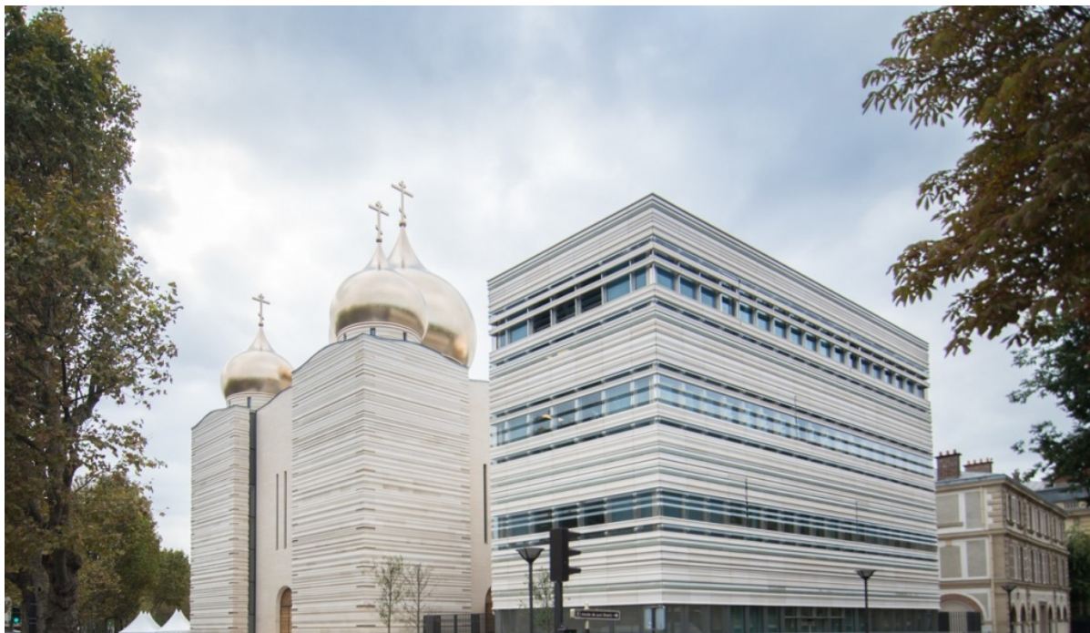
il centro ortodosso russo a Parigi

Durante il periodo sovietico, la Chiesa ortodossa russa non era assolutamente in grado di rispondere alle catture in stile di razzia dei suoi territori canonici e di opporsi efficacemente alle affermazioni papiste del Fanar. Ma ora la situazione è radicalmente diversa; ora la Chiesa ortodossa russa può ben organizzare un'opposizione ai tentativi di Costantinopoli di diventare un "Vaticano ortodosso".