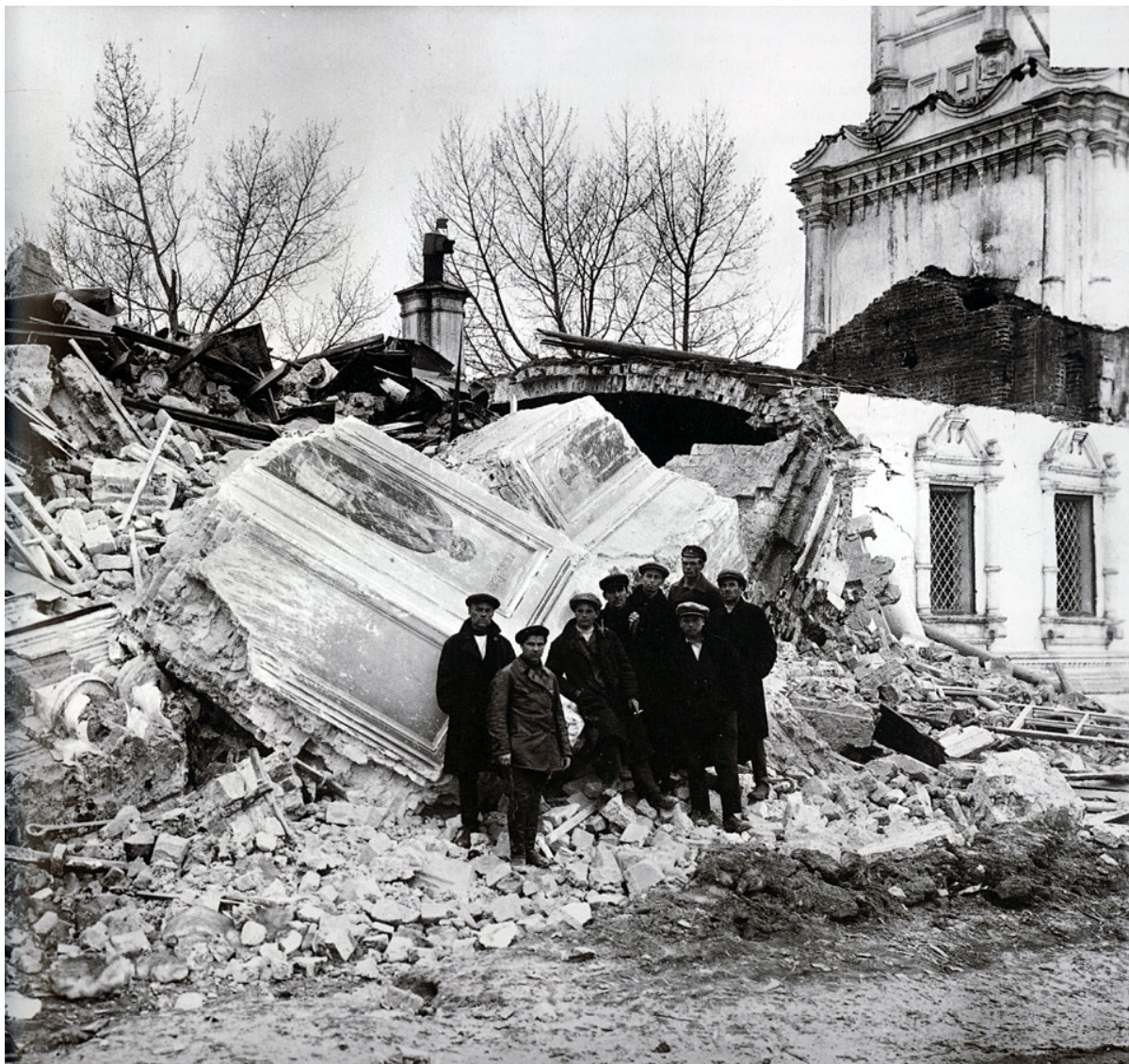
una chiesa distrutta dalle autorità sovietiche

Lo stato sovietico considerava la distruzione fisica delle chiese e del clero come parte delle sue politiche interne.