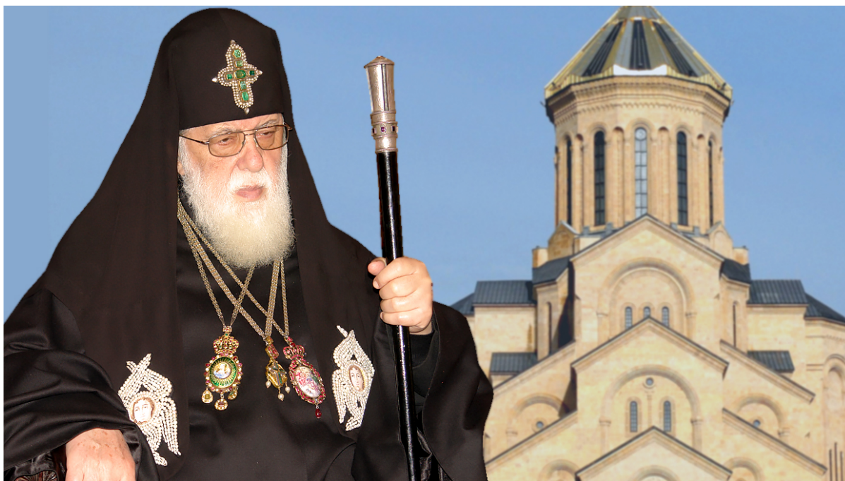
il patriarca Elia della Georgia

...come deve essere la Chiesa ortodossa georgiana.