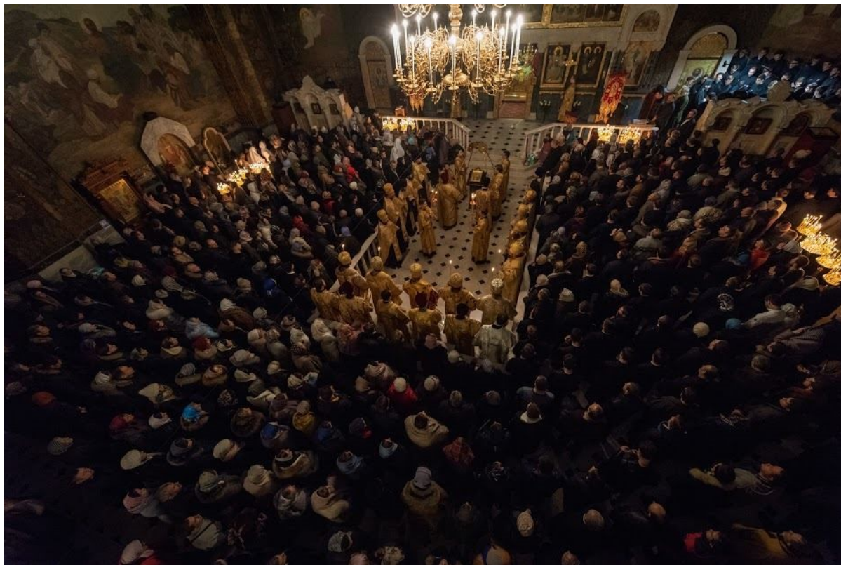
funzioni serali nella chiesa della Trapeza alla Lavra delle Grotte di Kiev, 15 dicembre 2018

Dopo aver attraversato le porte sante sotto l'antica (XII secolo) chiesa-cancello della Santissima Trinità, mi sono ritrovato sul territorio innevato della Lavra, dove regnava una sorta di quiete ultraterrena... Ho camminato lungo i vicoli innevati dell'antica monastero fondato dalle grotte di Kiev e ne ho goduto la quiete piena di grazia.