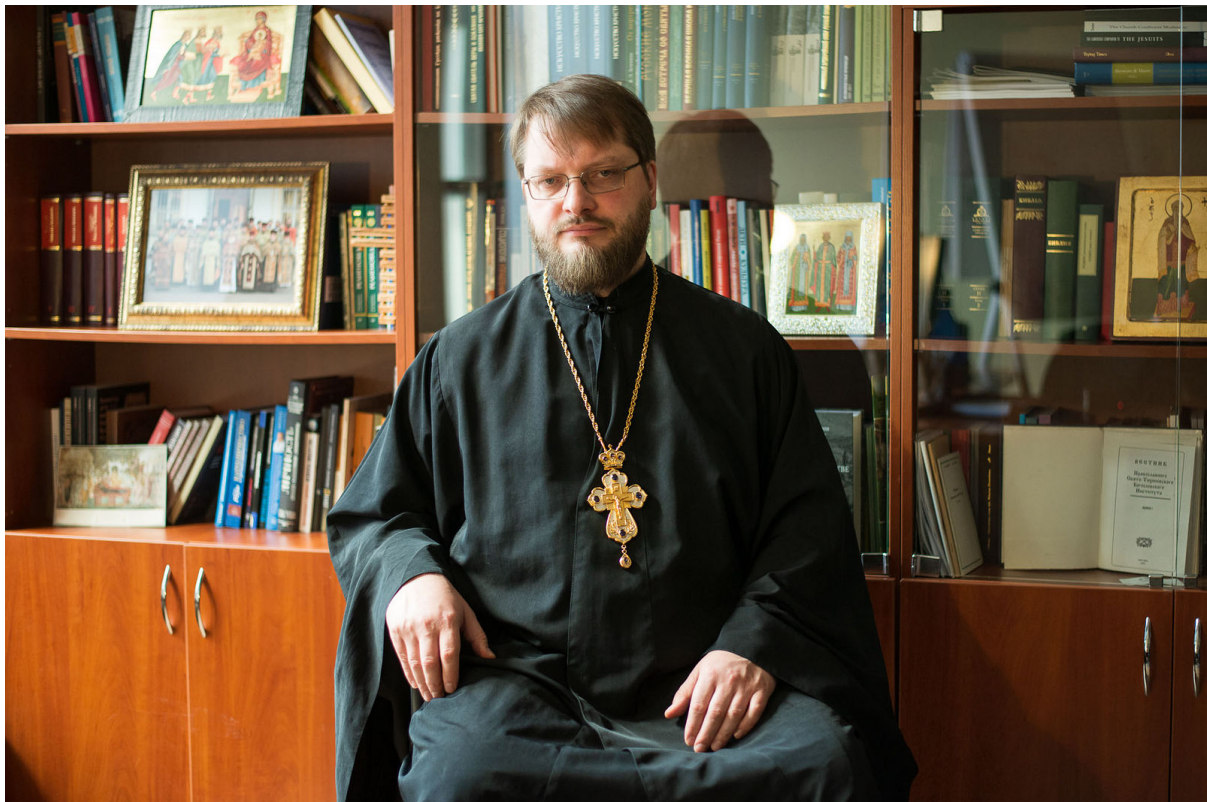
l'arciprete Nikolaj Emel'janov

Intervista di Jurij Pushchaev all'arciprete Nikolaj Emel'janov Orthodoxie.com , 28 giugno 2019