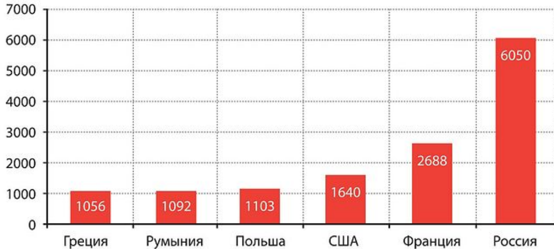
Диаграмма 2. Количество мирян на одного священника в католической церкви в сравнении с православными церквями России, Греции и Румынии. (Данные 2011 года, по Греции – 2016 г., по Румынии – 2014 г.) 455