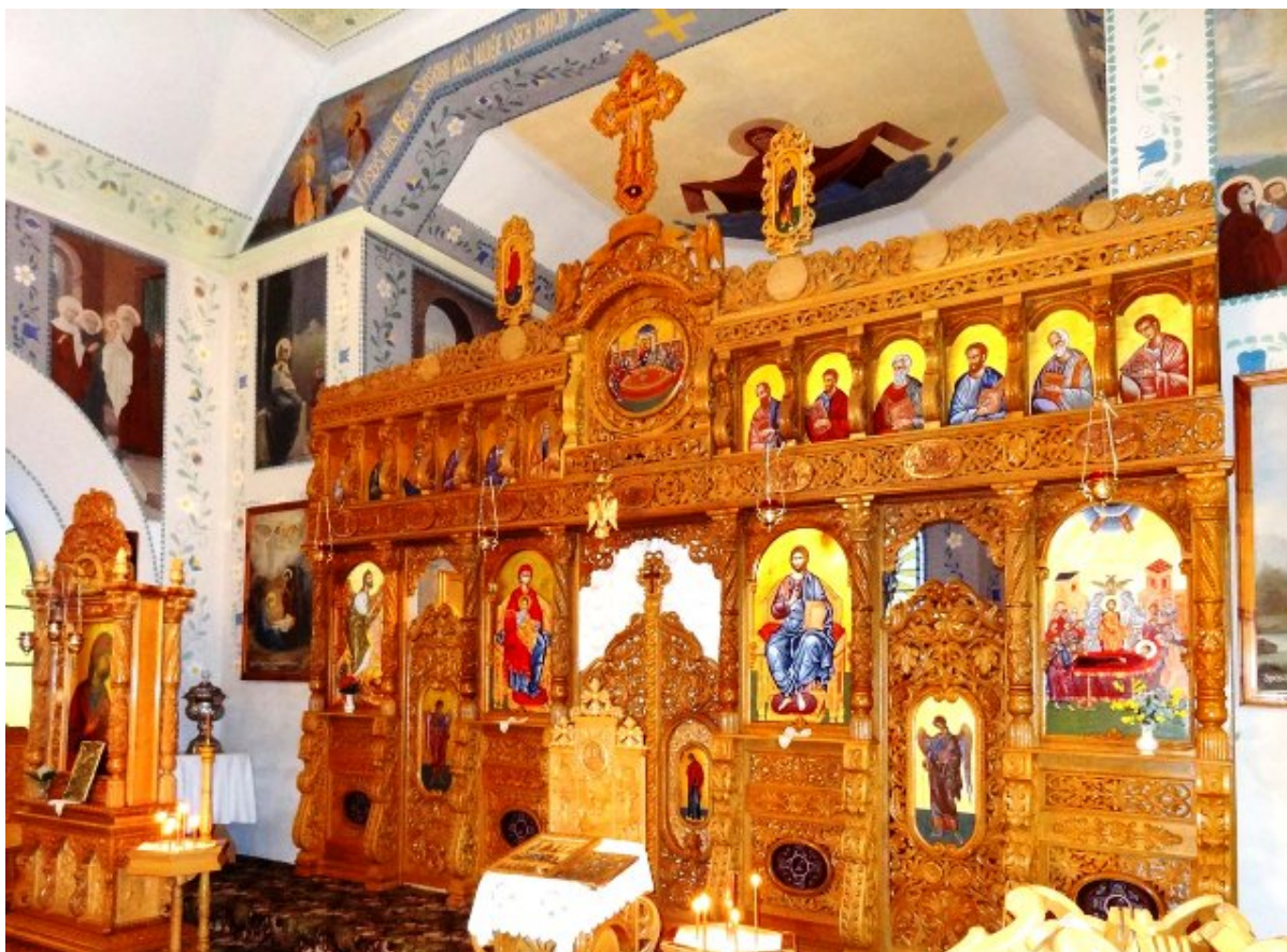
monastero della Dormizione.

Pertanto, il Patriarcato di Costantinopoli ha istituito un monastero / associazione sul sito di un convento preesistente della Chiesa delle terre ceche e della Slovacchia con tre membri che non hanno alcun legame con il monastero esistente.