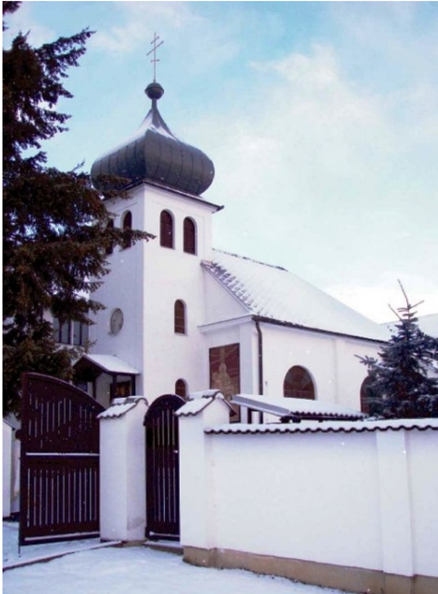
convento della Dormizione della santissima Theotokos a Vilemov, Repubblica Ceca.

Non ci sono molte informazioni al riguardo su Internet. Ci sono alcune foto sul sito ceco "Luce dell'Ortodossia" e alcune informazioni per i pellegrini sul sito web "Alfabeto del pellegrinaggio" :