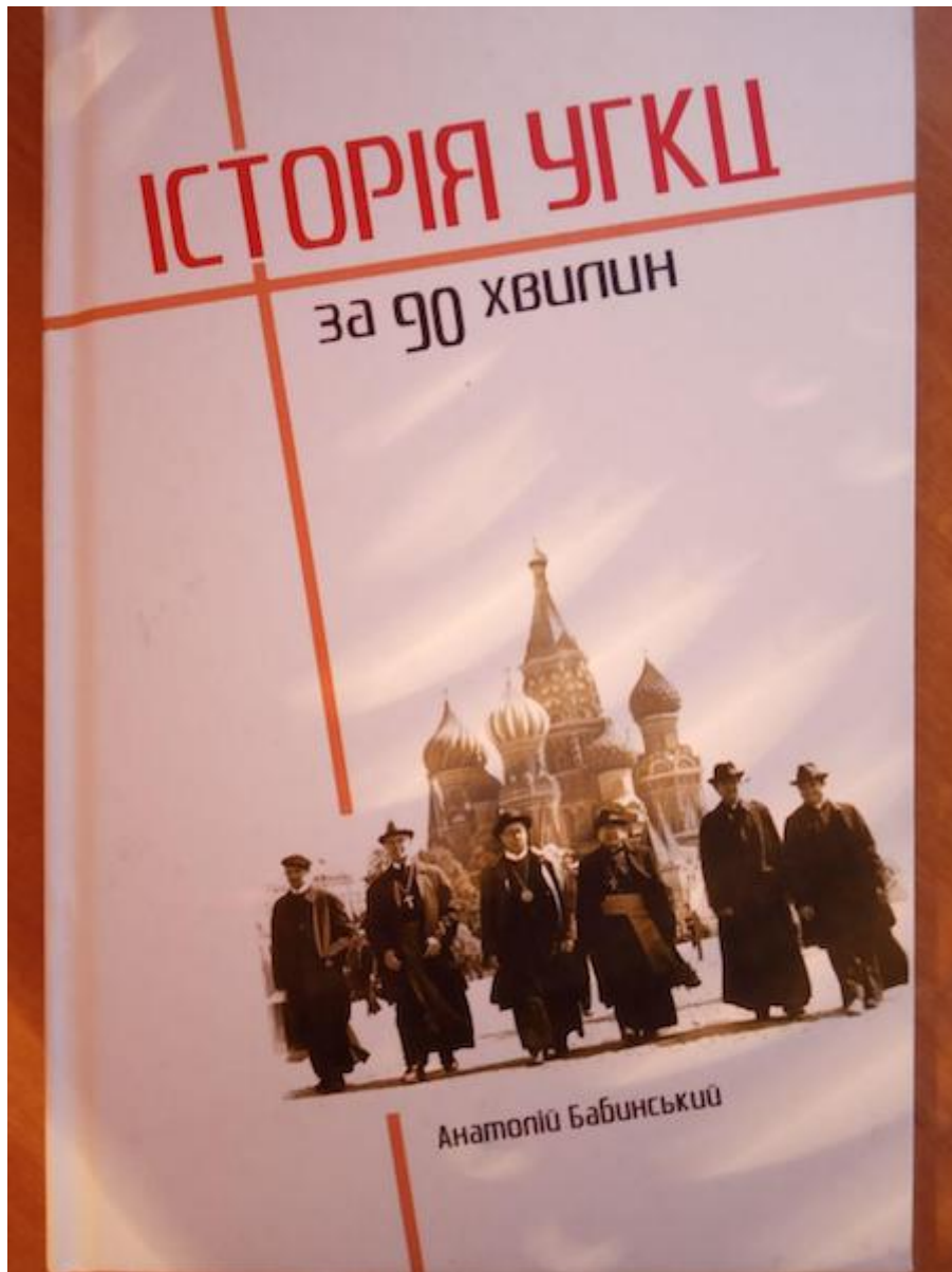
il libro di Anatolij Babinskij "La storia della Chiesa greco-cattolica ucraina in 90 minuti".

Allo stesso tempo, "si dimentica" di menzionare che la metropoli della Rus' a quel tempo non era solo "in unità" con Costantinopoli ma sotto la sua diretta giurisdizione e non poteva per definizione assumere una posizione neutrale nelle questioni ecclesiali.