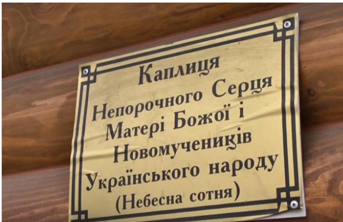
cappella della Chiesa greco-cattolica ucraina sulla via Institutaska a Kiev

Tuttavia, accanto al sostegno del "potere" al Majdan, gli uniati non hanno trascurato la sua componente sacrale o religiosa. In particolare, hanno organizzato la cosiddetta cappella ecumenica del "Cuore immacolato della Madre di Dio e dei nuovi martiri del popolo ucraino (centuria celeste)" nel centro di Kiev.