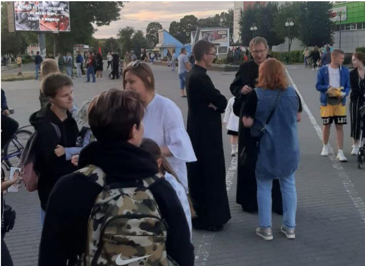
chierici cattolici alle proteste a Minsk.

Sappiamo che i cattolici, per lo più uniati, hanno svolto un ruolo fondamentale nell'attrarre persone all'Euromajdan in Ucraina. Anche in Bielorussia non si fanno da parte. Ecco una foto delle proteste in cui vediamo diversi religiosi cattolici.