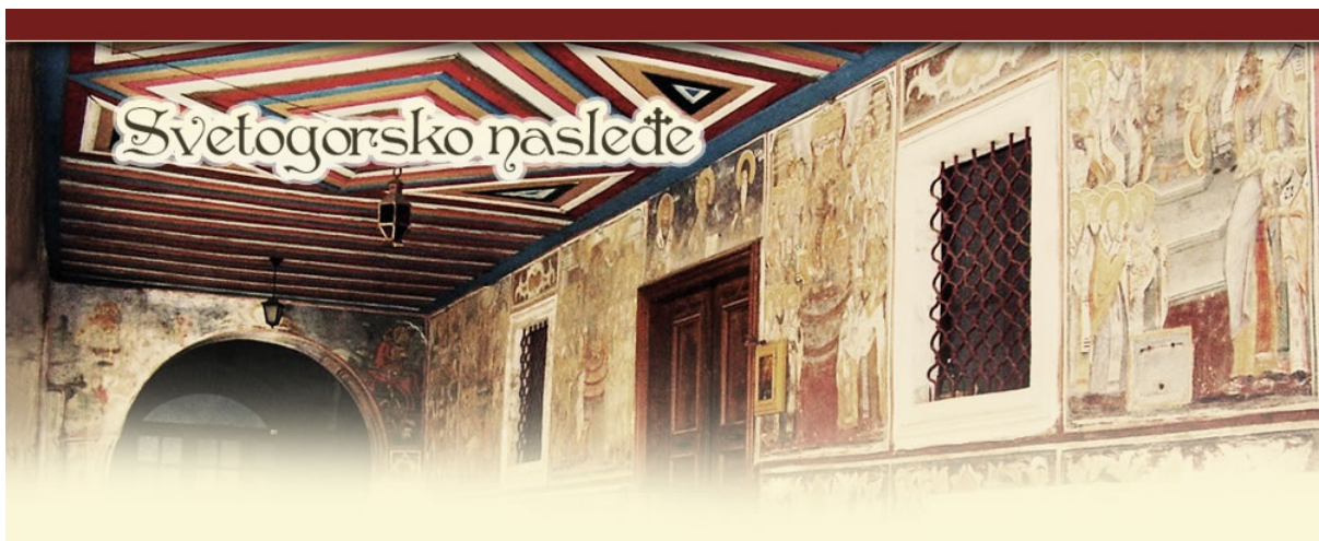
Weblog "Eredità athonita"

"Dal momento che è il sito web di un monastero, il suo scopo è quello di diffondere e proclamare la parola di Dio. Abbiamo preso le parole del nostro Signore Gesù Cristo, che ha comandato ai suoi discepoli, i santi apostoli e i loro seguaci: "Andate in tutto il mondo e predicate il Vangelo a ogni creatura". L'inizio del monachesimo è legato ai monasteri dei deserti, ma i monaci sono sempre stati testimoni della parola di Dio nel mondo. Le seguenti parole, pronunciate dal Salvatore, sono importanti per tutti i tempi: "La messe è molta, ma gli operai sono pochi". Il nostro sito web ha carattere missionario e universale, il che significa che gli articoli sono pubblicati in varie lingue. Oltre alla nostra lingua serba, che va da sé, ci sono testi ortodossi scritti in russo, inglese, tedesco, francese e greco. Tutte queste lingue sono rappresentate sul nostro sito web. Ancor più, il sito del monastero è classificato come missionario, perché è incluso nel blog della Chiesa ortodossa "Missione ortodossa", dedicato ai greci in tutto il mondo, su cui c'è un link speciale per Radio Blagovesti. Su