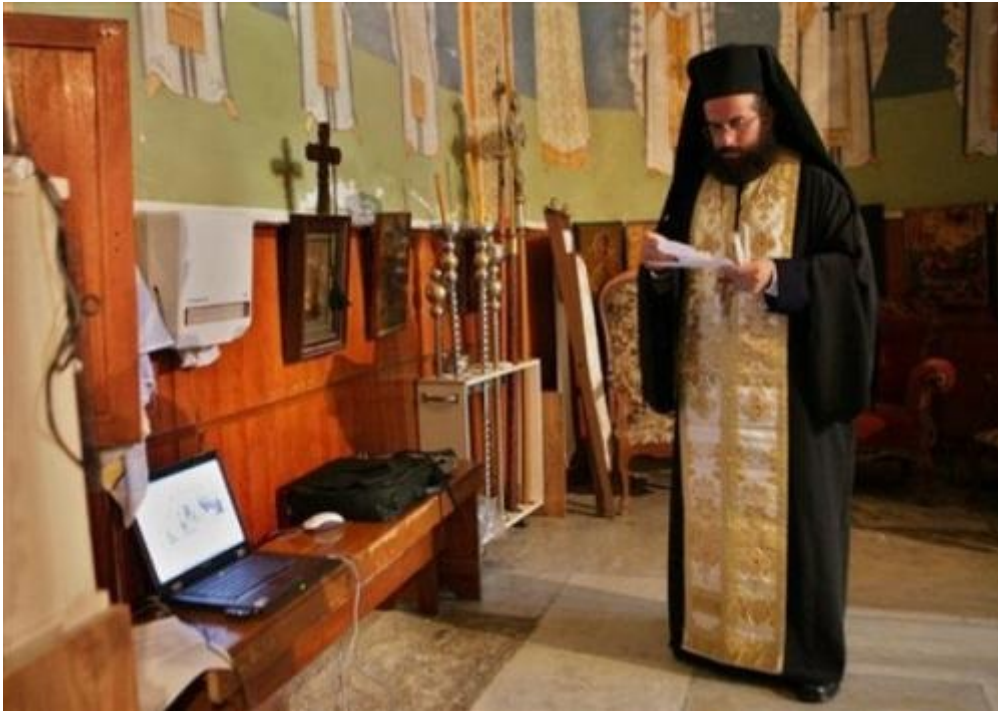
Monaco con WiMAX sul Monte Athos