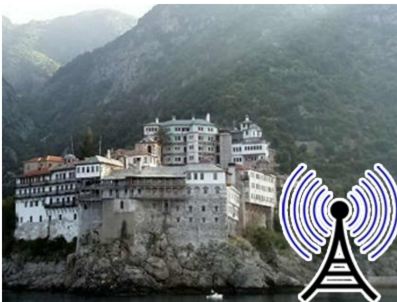
WiMax sul monte Athos

monastiche). WiMax è una rete wireless che funziona a energia solare.