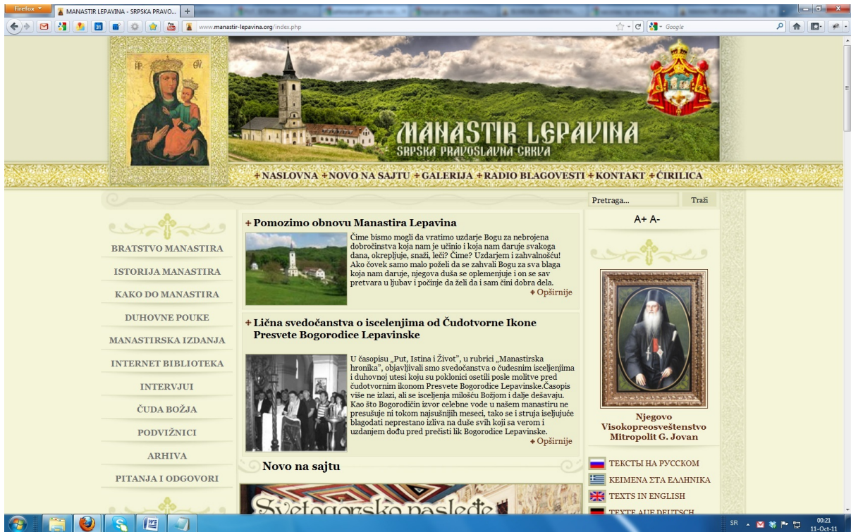
Sito web del monastero di Lepavina