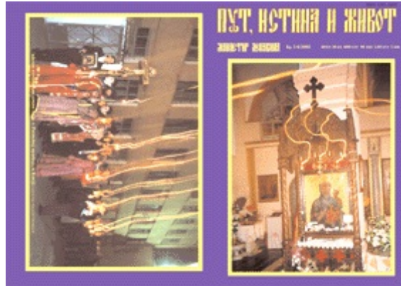
La rivista "La via, la verità e la vita"