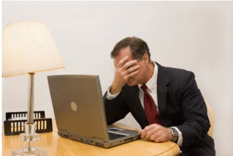
Lezione semiseria sulle vie che portano alla celebrità 24 febbraio 2014

Da un paio di mesi non mettevamo piede sul blog L'Arpa di Davide , del nostro confratello ieromonaco Marco. Guardando le ultime novità sul blog, abbiamo visto questo curioso post di Natale: