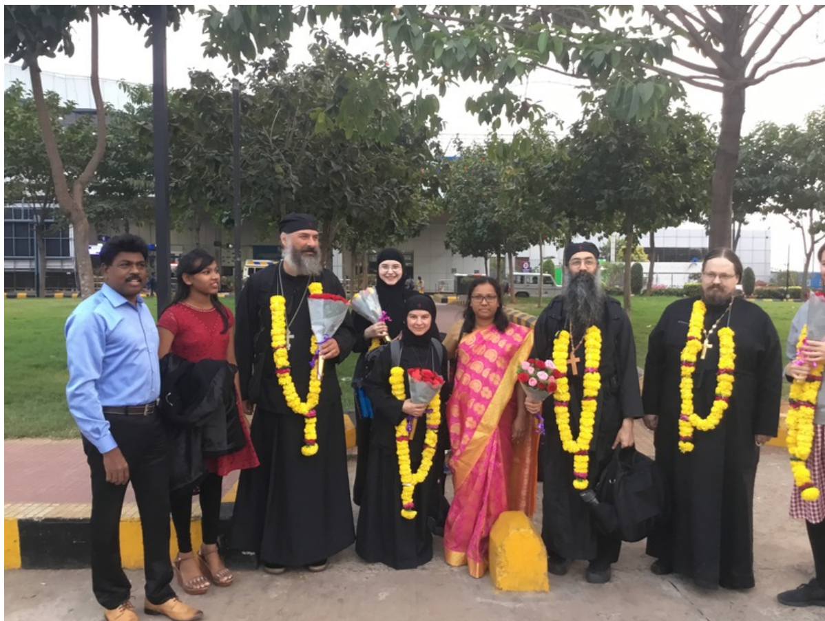
il gruppo originario della missione in India.