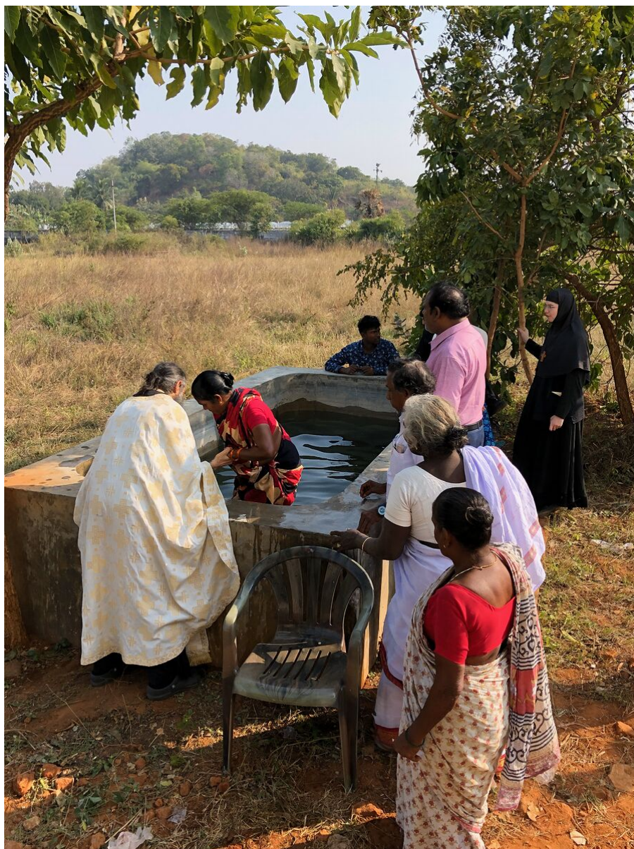
fedeli indiani appena battezzati.

ortodosso russo con una selezione delle vite dei santi, un passo importante per stabilire la fede ortodossa nella regione. La traduzione e la pubblicazione del calendario costerà 2.000 dollari.