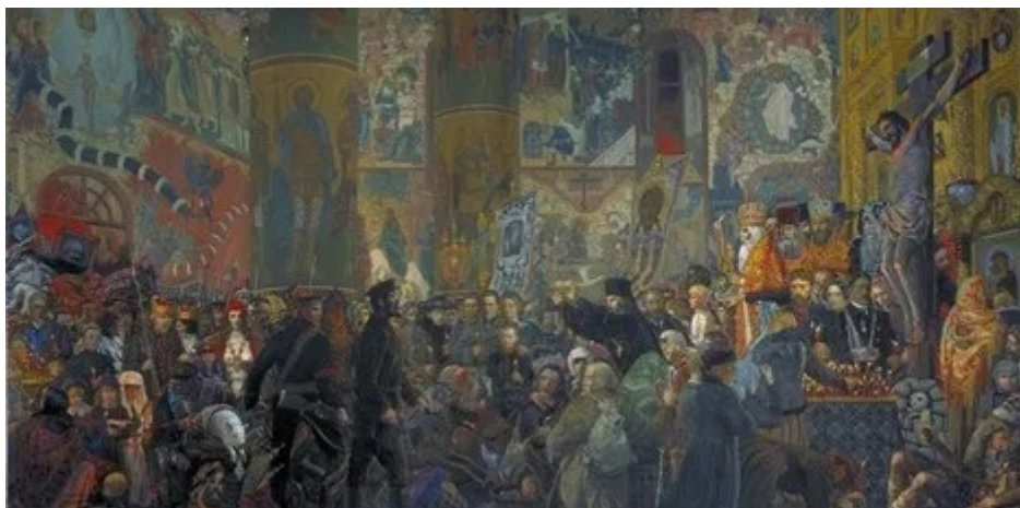
i bolscevichi fanno irruzione in una chiesa

Il vero cristianesimo ortodosso è radicalmente altro dal mondo, proprio come il nostro Dio è radicalmente altro. Mentre gli intellettuali di San Pietroburgo erano quasi apostati (invitando perfino i guaritori occidentali e i pentecostali a predicare nelle loro case) e abbracciavano il materialismo occidentale, i santi, il clero e i semplici fedeli mantenevano la fede. Si aggrapparono alla loro fede mentre l'intelligenza apostata e i bolscevichi li brutalizzavano, finché non furono nuovamente liberati con il crollo della cortina di ferro. [13]