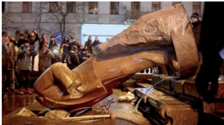
Nazionalisti ucraini distruggono un monumento di Lenin

Stiamo assistendo a una massiccia ondata di demolizioni di statue di Lenin in Ucraina. L'ultimo esempio è stato a Kharkov, dove la più grande statua di Lenin in Ucraina è stata rovesciata da estremisti e membri neo-nazisti del Settore destro e del battaglione Azov.