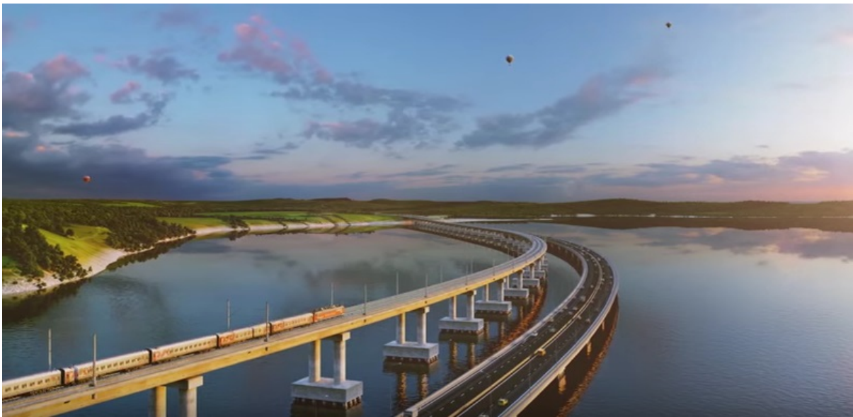
Previsione artistica del ponte di Kerch verso la Crimea, una volta completato

di Ricky Twisdale da Russia Insider , 20 gennaio 2016