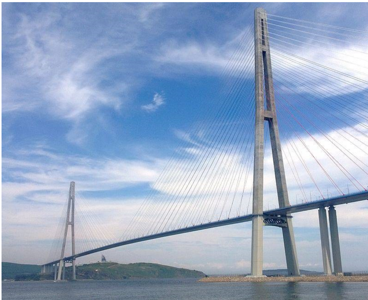
il ponte dell'Isola Russkij: il più lungo ponte strallato del mondo

La Russia ha costruito numerosi nuovi ponti negli ultimi anni, come il ponte di Khabarovsk costruito nel 1999 (presente sul retro della banconota da 5.000 rubli) e il super-moderno ponte dell'Isola Russkij verso Vladivostok, completato nel 2012: