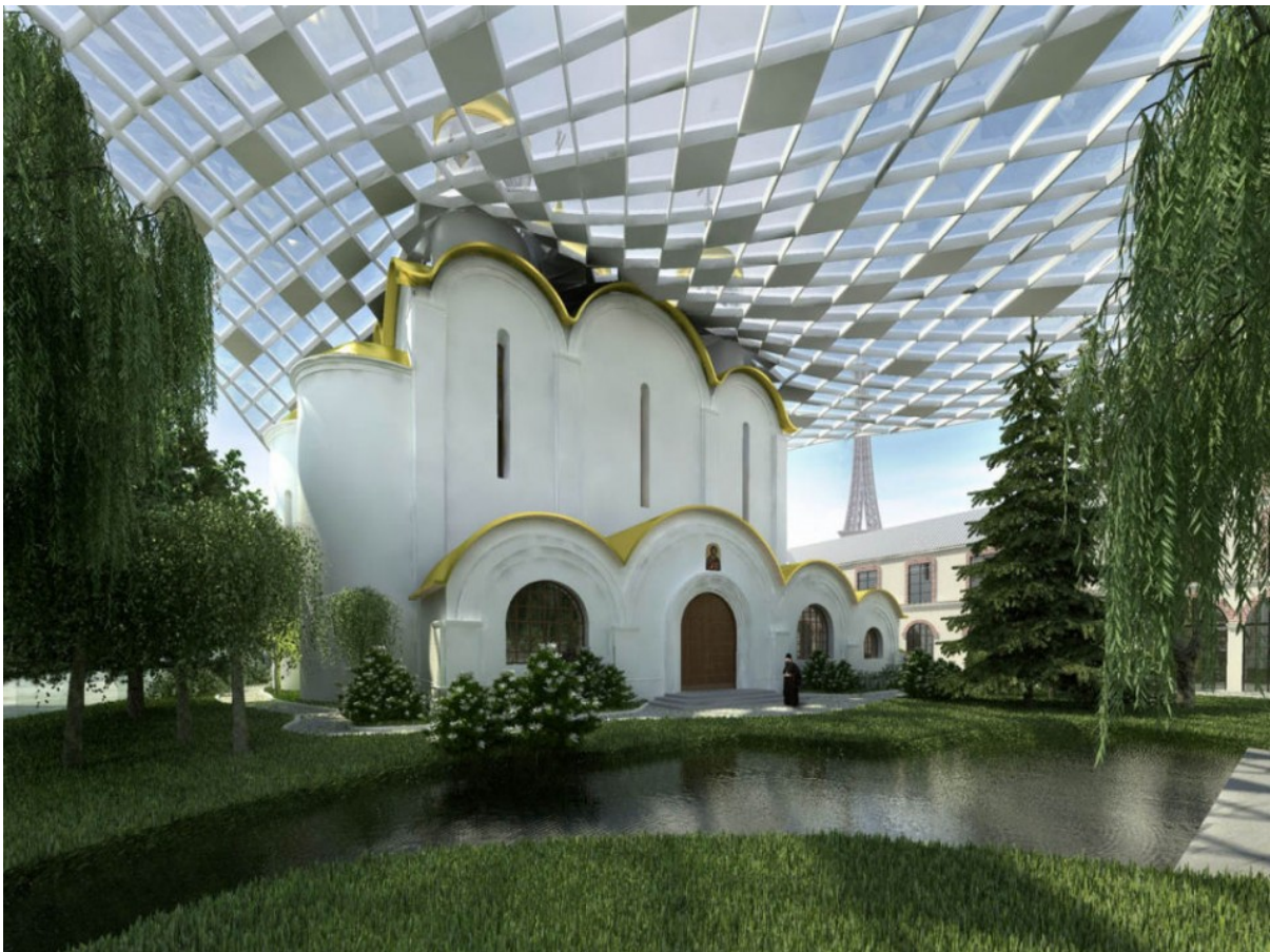
Il progetto è stato soprannominato "Mosca sulla Senna"

Decine di migliaia di russi vivono a Parigi e nei dintorni. La capitale francese era diventata negli anni '20 una destinazione preferita dei 'russi bianchi' anti-bolscevichi, in fuga dalla presa di potere comunista della Russia.