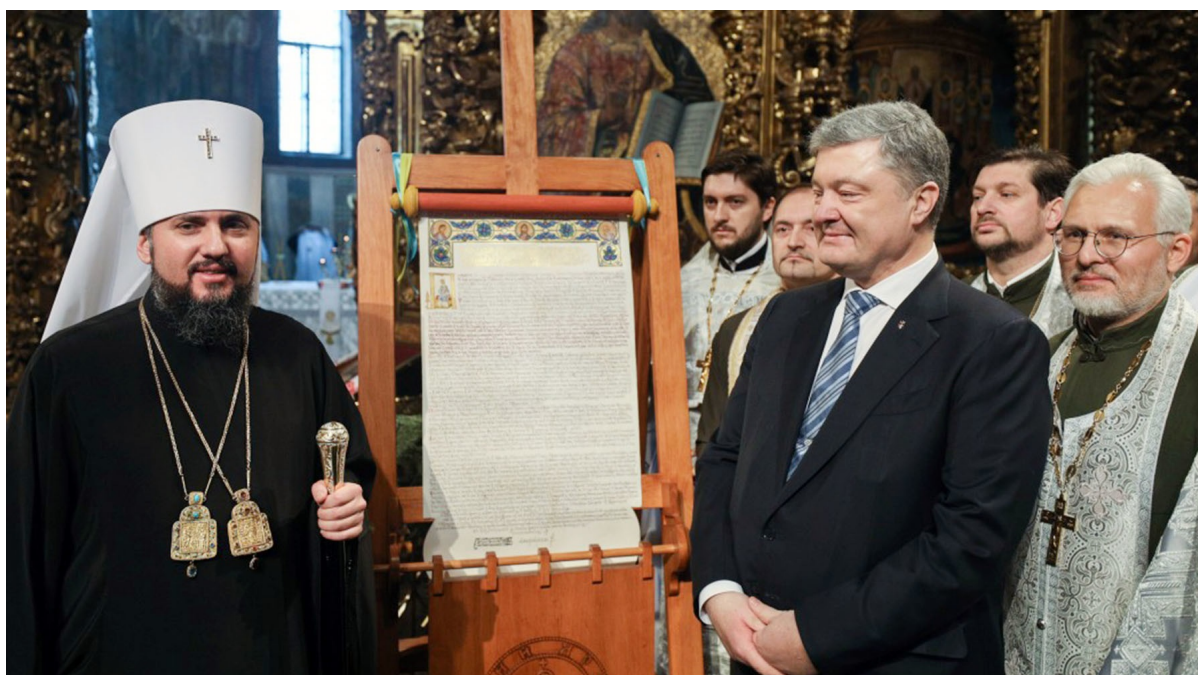
Petro Poroshenko ed Epifanij Dumenko durante il tour pre-elettorale del Tomos, 2019

Non meno evidente è l'assurdità della retorica "patriottica" dell'ex presidente. Petro Poroshenko per tutto il suo mandato presidenziale ha continuato a lamentarsi della lotta per l'indipendenza dell'Ucraina, anche se i documenti pubblicati indicano il contrario - in effetti, le politiche interne ed estere dell'Ucraina erano subordinate alla volontà del "padrone bianco" d'oltremare. Il fatto che l'ufficio di Joe Biden abbia affermato che le conversazioni registrate non rivelavano nulla di nuovo è una piccola meraviglia. In effetti, non era un segreto che le nomine e i licenziamenti di alti funzionari governativi fossero concordati o addirittura compiuti su ordine dell'amministrazione americana, mentre le tariffe dei servizi pubblici aumentavano esponenzialmente su richiesta del FMI e così via.