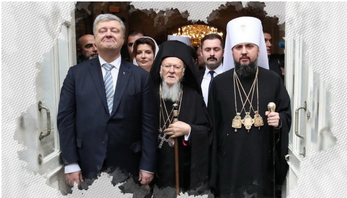
Petro Poroshenko, Epifanij e il patriarca Bartolomeo dopo la firma del Tomos

Finora, i resoconti di campo della "Chiesa ortodossa dell'Ucraina" dimostrano che questa struttura si merita il proprio padre fondatore. Sequestri e roghi di luoghi di culto della Chiesa ortodossa ucraina, pestaggi di credenti, falsificazioni e frodi durante il trasferimento delle comunità ortodosse alla "Chiesa ortodossa dell'Ucraina" e tutte le altre azioni "nobili" parlano più forte di ogni altra cosa.