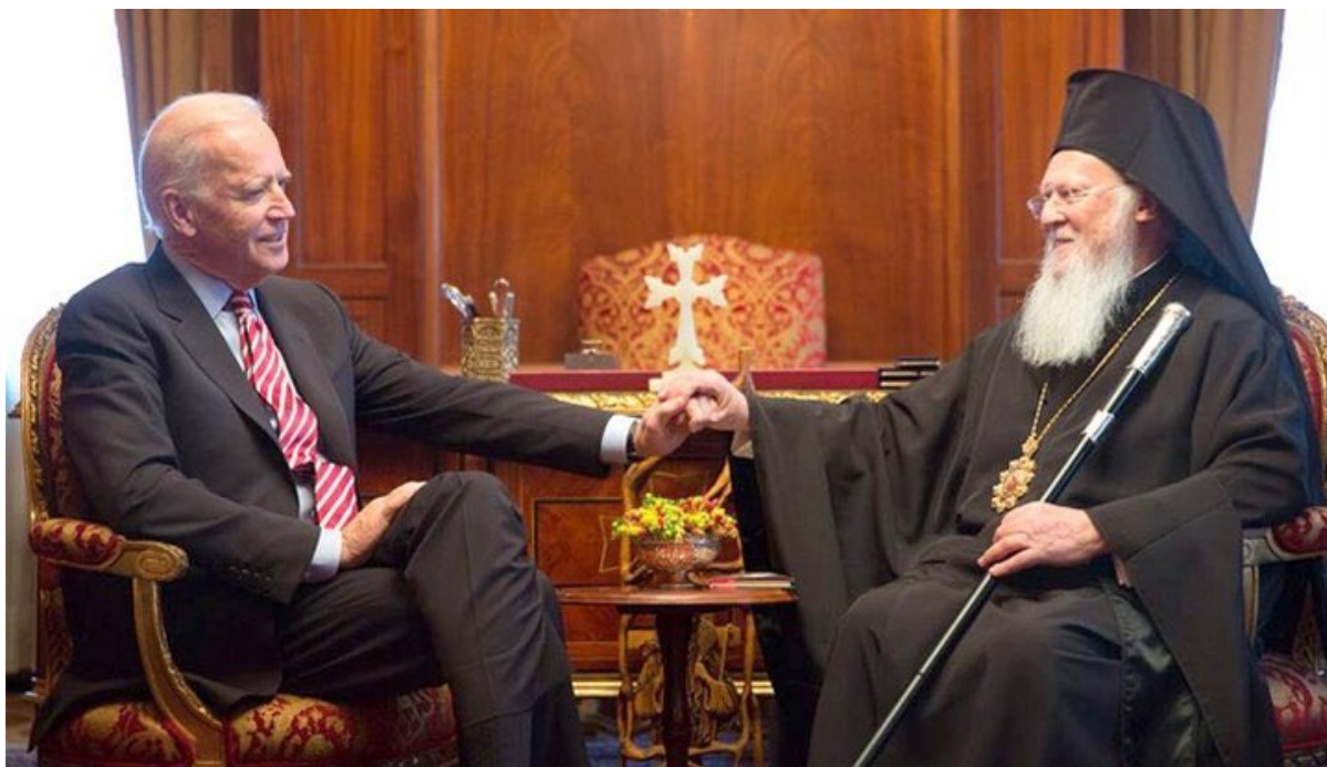
Joe Biden e il patriarca Bartolomeo durante un incontro al Fanar

Tuttavia, sarebbe un errore presumere che dopo aver appreso dello scandalo su Poroshenko, il patriarca Bartolomeo ne sarà molto deluso. Probabilmente avrebbe potuto conoscere alcune qualità personali dell'ex presidente ucraino. Certamente ha agito come se conoscesse bene le opinioni della seconda persona coinvolta nello scandalo: Joseph Biden. Si conoscono da molto tempo.