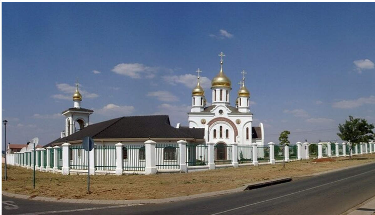
il complesso della Chiesa ortodossa russa a Johannesburg, in Sudafrica.