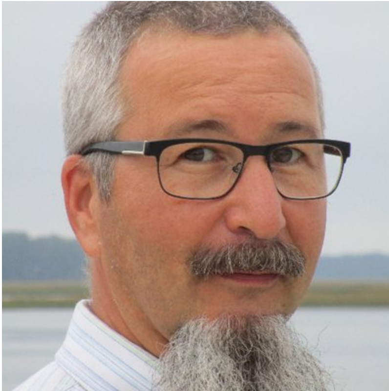
di Dmitry Orlov The Saker , 27 febbraio 2022

Giovedì scorso ho ripubblicato i miei "primi dieci segni che la Russia ha invaso l'Ucraina" di 8 anni fa, quando era iniziato il cambio di regime ucraino e la guerra civile, e l'Occidente affermava continuamente che la Russia aveva invaso l'Ucraina. Ebbene, giovedì scorso la Russia ha effettivamente invaso l'Ucraina.