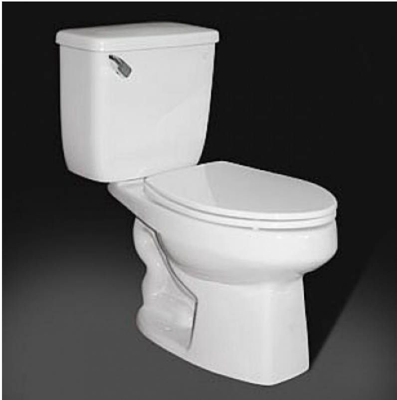
L'ambita Coppa di porcellana

È giunto il tempo di riconoscere l'eccellenza!